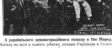
З українського демонстраційного походу в Нью-Йорку. Могила на возі в пам'ять убитих лахам Українців в Галиччині.

Читайте українські книжки і газети, бо часто читане веде до просвіти, а просвіта — се сила. — Писіть по шпинку конюска “СВОБОДА”, 83 Grand St., Jersey City, N. J.