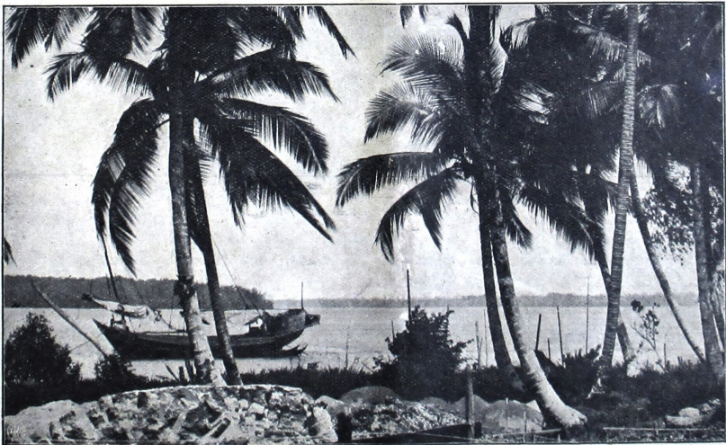
සිංහල ආර්ථික පුවතේ අංක 3 වන අංකයේ අංක 150 K. P. M. ආර්ථික පුවතේ අංක 3 වන අංකයේ අංක 150

සිංහල ආර්ථික පුවතේ අංක 3 වන අංකයේ අංක 150