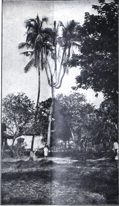
ပိန္နဲတစ်ပင်တို့၏ အလှပုံအစုံ

ယုံကြည်စိတ်ချရသော အချက်အလက်များကို အခြေခံ၍ အကုန်အစင် အစွမ်းအားဖြင့် ပြုပြင်ဆင်ခြင် နေကြောင်းကို ဝိညာဉ်ကျွမ်းကျင်သူများက ခြေရာခံကြသည်။