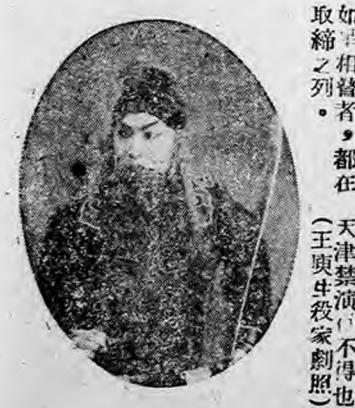
楊老四引了會有一被問，現則因