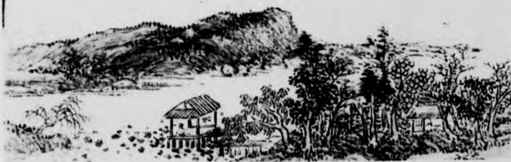
(、期七〇四第刊本見、傳小誥董及明說)