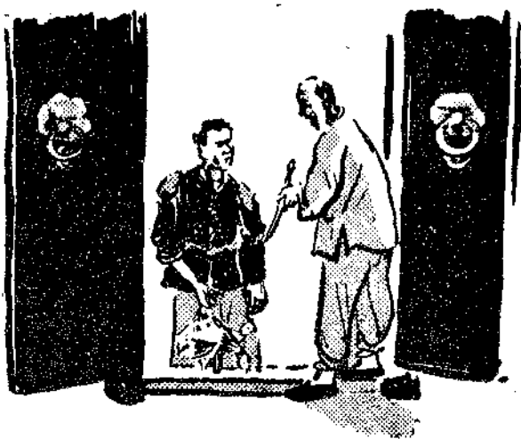
那入吃了驚，打量老好人一番。

求求少爺去。他是上過城的，却沒有到過少爺的家，他只曉得少爺家的大門，是漆黑的，上面有鐵環，敲起來響噹噹的，門的兩面有石獅子。他就照這個形樣，到處問着，問了一家不是，再問一家也不是，最後問了一家，看門的人就盤問他說：「你這個鄉下佬，找入要有個姓名呀？」他摸摸腦殼想了半天才說：「有是有的，我可不敢叫哪，人家都叫他少爺呀」。那人橫了他一眼，連連叫了幾聲說：「少爺，