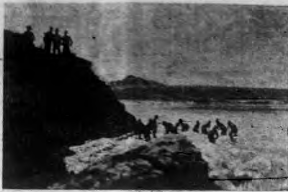
黃河農墾區萬興圩放水情形