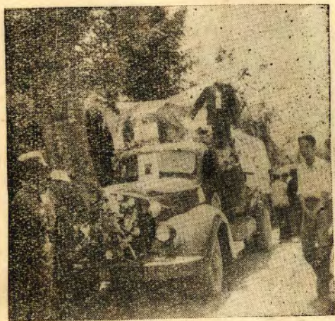
忠魂移入民教館停放