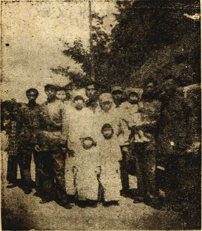
戴故師長遺族合影