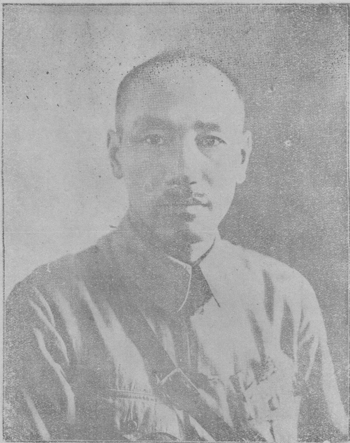
國民革命軍總司令蔣中正先生