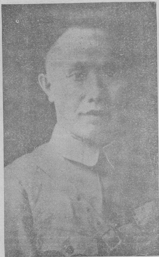
國民革命第一軍軍長何應欽先生