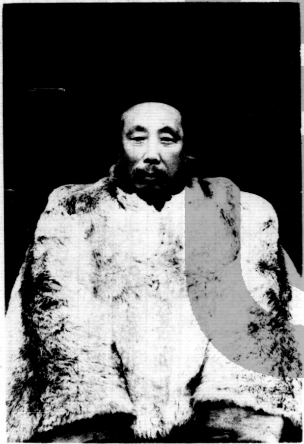
鳳孫先生七十四歲小影