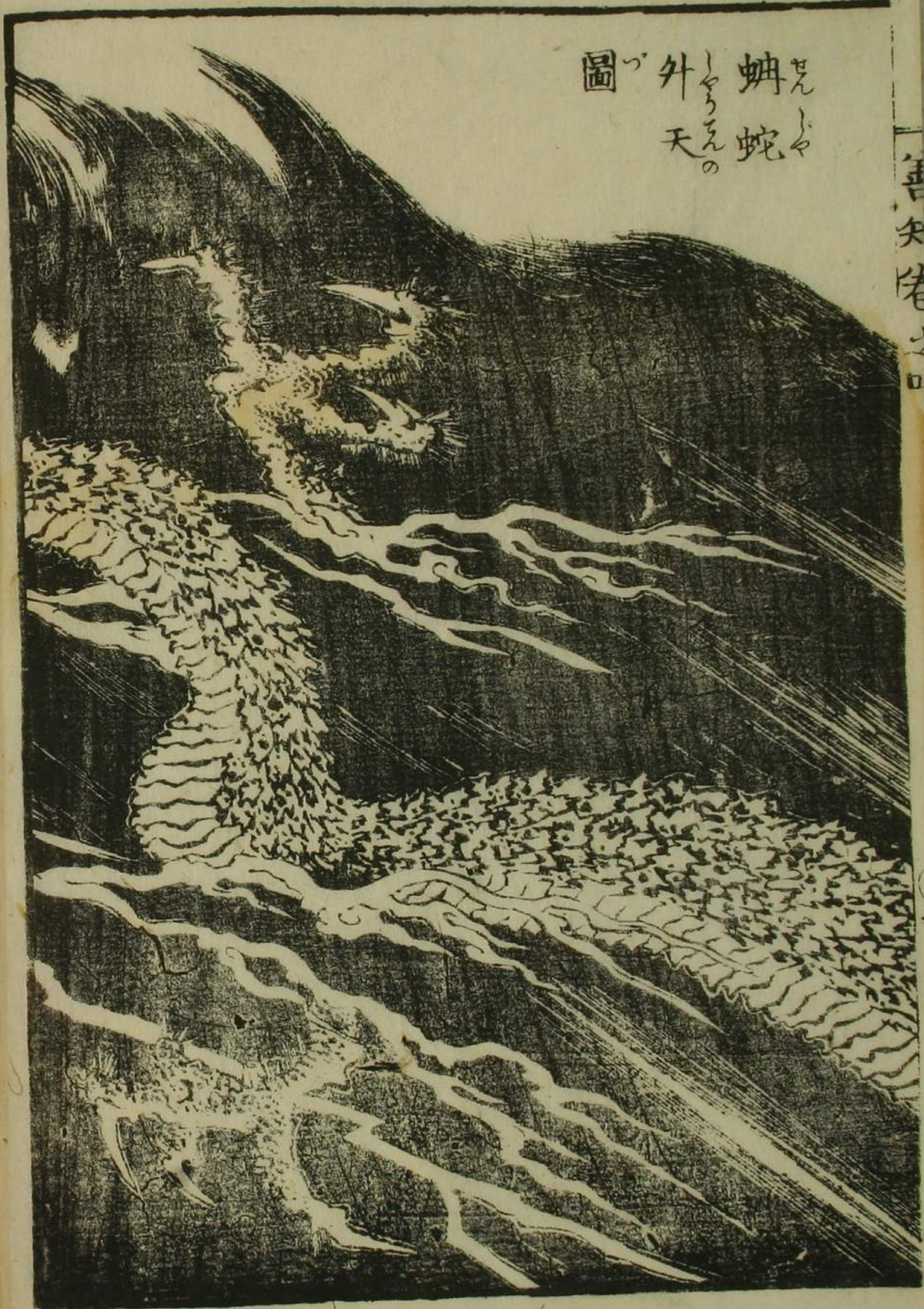
天竺蛇の 見ゆ 外 づ 圖