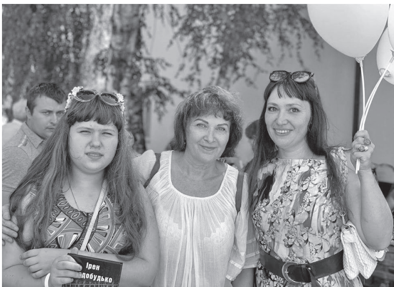
Ірен Роздобудько (у центрі) із поціновувачками її творчості біля Козельщинської районної бібліотеки

ДОВІДКОВО: Проект «Мереживо. Літературні читання в містечках України» покликаний підвищити престиж читання в райцентрах України, знайомити мешканців українських містечок із сучасною українською літературою та включити їх у культурне поле, спільне з великими містами.