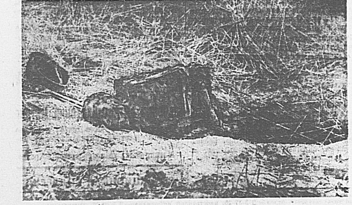
Труп красноармейца, обнаруженный нашими бойцами в районе населенных пункт- тов Кузьмино и Ивильно (Западный фронт), отбитых у немцев. По сви- детельству местных жителей, фашистские людоеды сожгли захваченного ими в плен раненого красноармейца живым, после пыток и издевательств над ним.