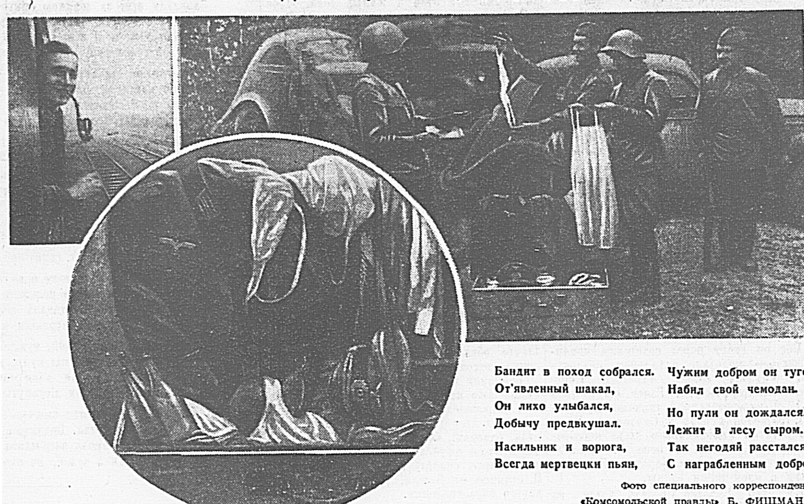
Бандит в поход собрался. Чужим добром он туго...