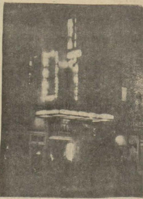
Gece Yeni sinema.

Yazın umumi eğlence yerlerinin müşterileri en ziyade ailelerini İstanbul'a gönderen erkeklerdir. Kışın gedikli bekâr müşterilerinin yaz gelince boruları buralarda pek ömez. Çünkü meydan, aileleri İstanbul'da olan bu erkekler kalır. Bunlar doymaz bir iştah ile buralara muntazaman devam ederler, kısa bir zamana inhisar eden aslanlıklarla bekârları sindirirler.