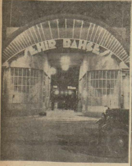
Şehir bahçesine giriş

Şehir halkının yegâne teneffüs pençeresi için yapılacak şey