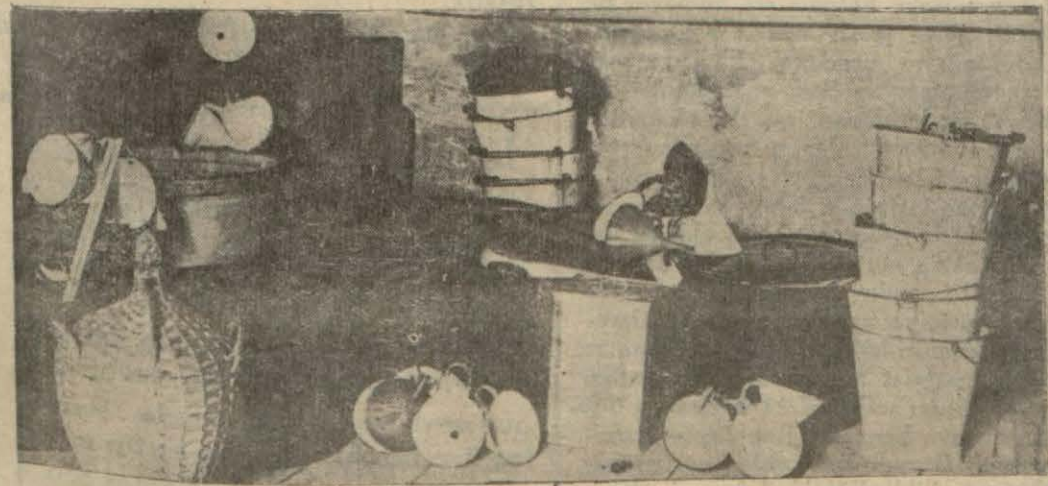
Gedikpaşada Madam Afroditi'nin evinde meydana çıkarılan aletler

Londra belediye reisinin riyaseti altında bulunan bu ziyafete 66 devlet murahhası iştirak etmiştir. Birçok nazırlar ve bu arada M. Mac Donald ziyafette bulunmuştur.