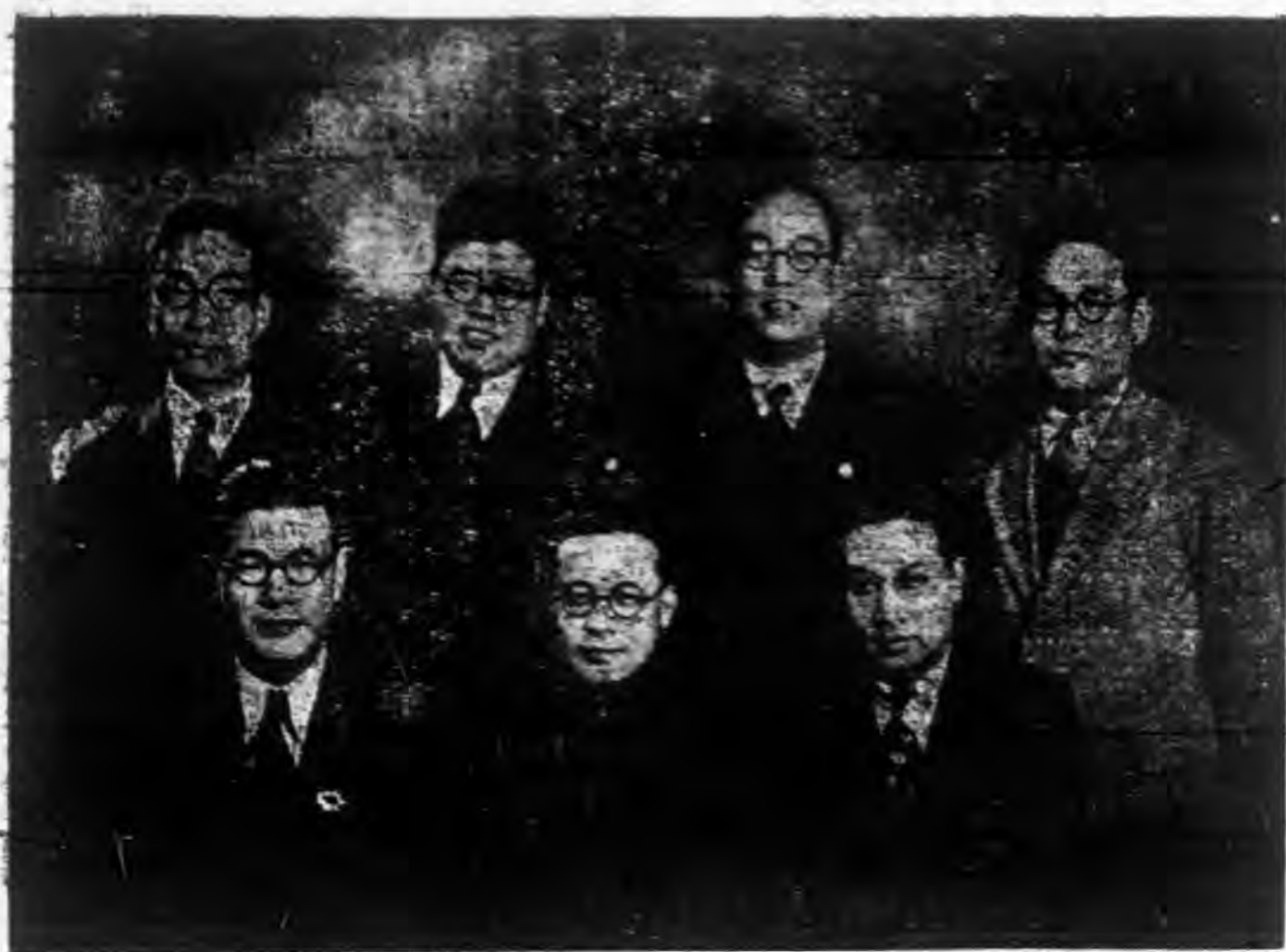
—— 聯第三隊 ——

去年第二十一屆徵友運動，承同志諸友熱忱贊助，成績異常圓滿。本會原擬於會後將各隊同仁攝影，製版刊行專冊，藉留鴻爪。祇以尚有二十餘隊未及攝製照片，故不克如期付印。茲者，本年又屆徵募運動開始，爰將上屆已攝照片各隊，先在本刊彙齊發表，此外未攝照片各隊同仁，仍請特別原諒是荷。