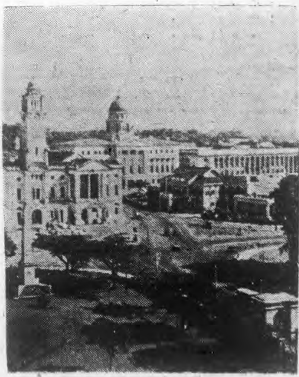
新加坡市街中心區