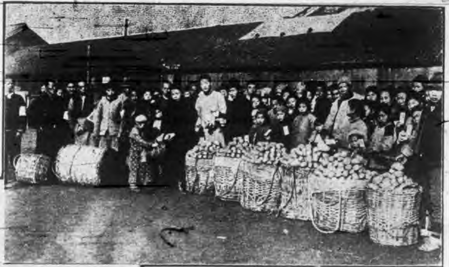
徐家匯一帶沿途難民 民叢集陸修士同難 民所全體職員分發 糧食之一角