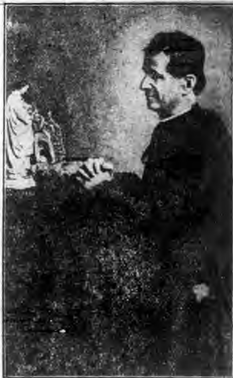
大教育家聖鮑斯高

中·以何種名義呢？師長？學監？不，慈父，慈父總不讓自己的小孩孤單着，當他們的自由還沒有受到完全的教育時·