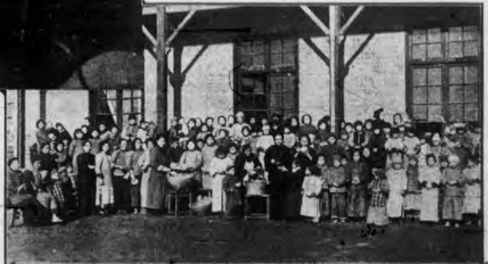
聖 母 院 婦 女 難 民 所 病 房 之 一 目

聖母院婦女收容 所徐滙一帶收容 所中獻堂會修女 到各所講解要理 因而得獲信光輝 洗者不計其數