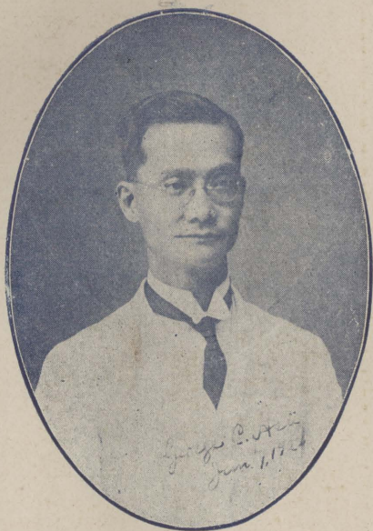
者 正 修 書 本 謙 徐