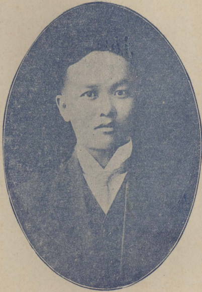
者 著 原 書 本 山 吳