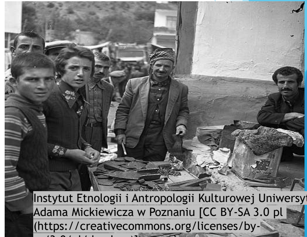
Instytut Etnologii i Antropologii Kulturowej Uniwersytetu im. Adama Mickiewicza w Poznaniu [CC BY-SA 3.0 pl ( https://creativecommons.org/licenses/by-sa/3.0/pl/deed.en )]