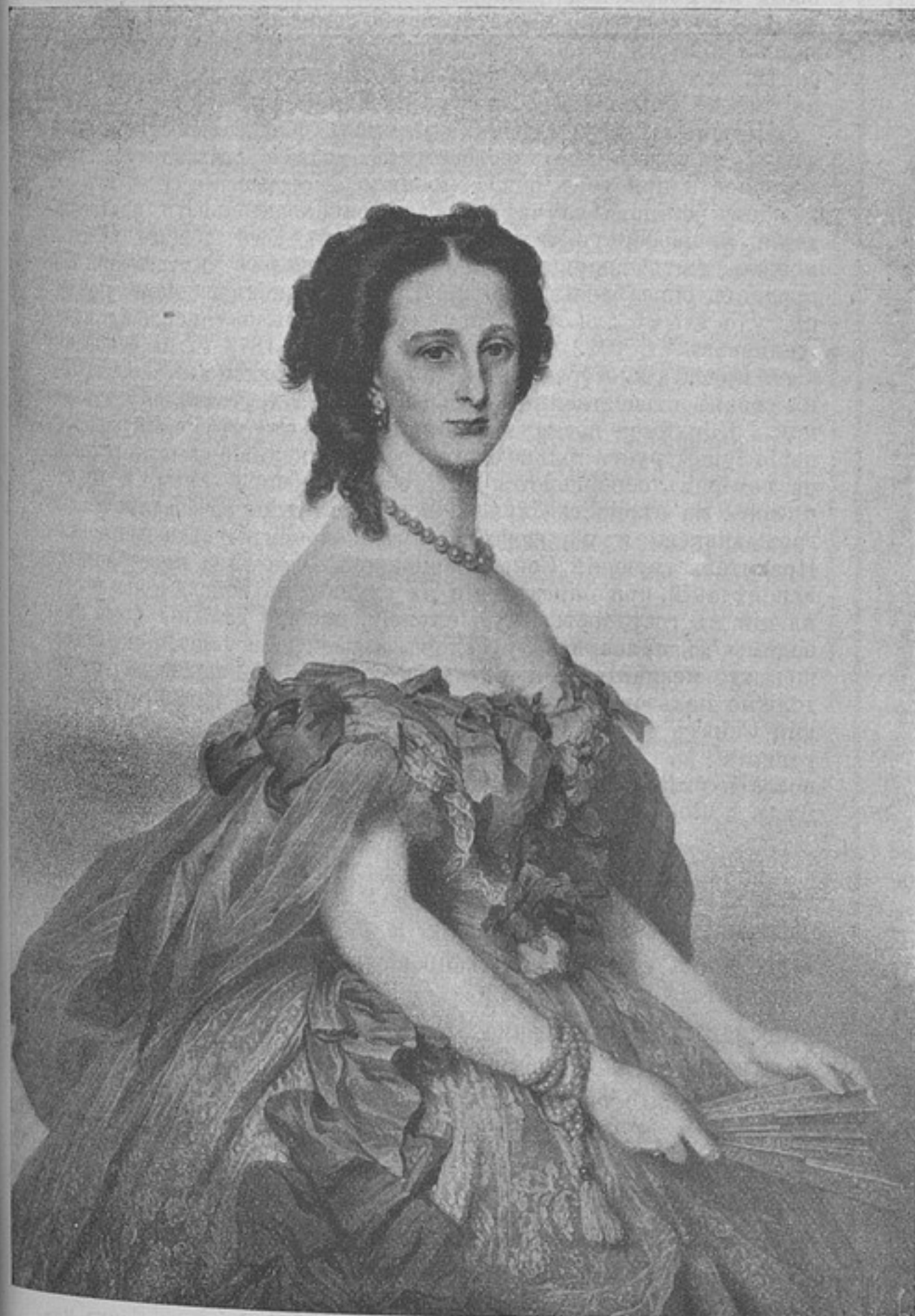
Ея Императорское Высочество Великая Княгиня Александра Іосифовна.