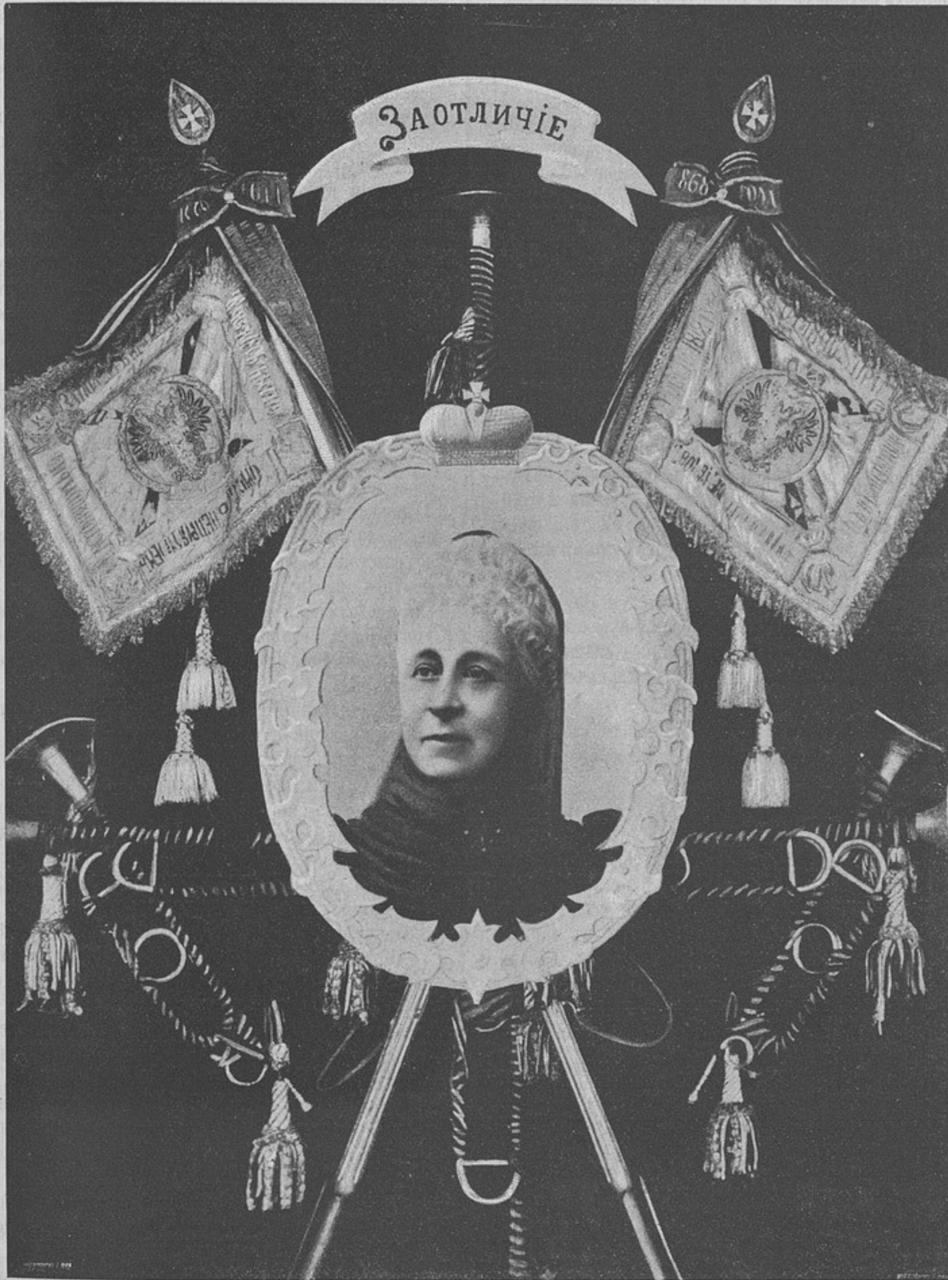
Знаки отличія и современный портретъ Августѣйшаго Шефа полка Ея Императорскаго Высочества Великой Княгини АЛЕКСАНДРЫ ЮСИФОВНЫ.

По даннымъ таблицы, вполне удовлетворяющими своему назначенію броне-бойныхъ орудій, можно признать въ настоящее время только 10-дм. пушки (а также и 11-дм. пушки въ 35 калибровъ длиною), такъ какъ только это орудіе мо-