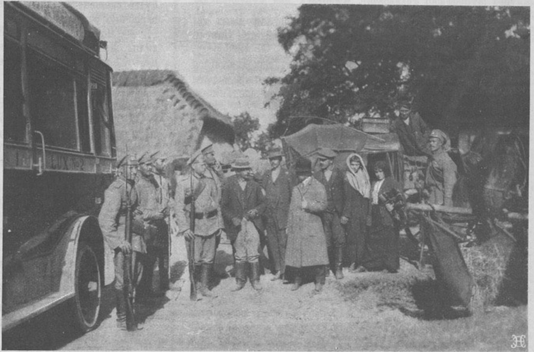
Съ театра военныхъ дѣйствій. Поймали шпионовъ. Съ фот. шт.-кап. Корсакова.

Описывая крутую дугу, насыпь все повышается и наконецъ доходитъ до самаго глубокаго мѣста ложины, гдѣ черезъ небольшую рѣчку перекинута желѣзнодорожная мостъ.