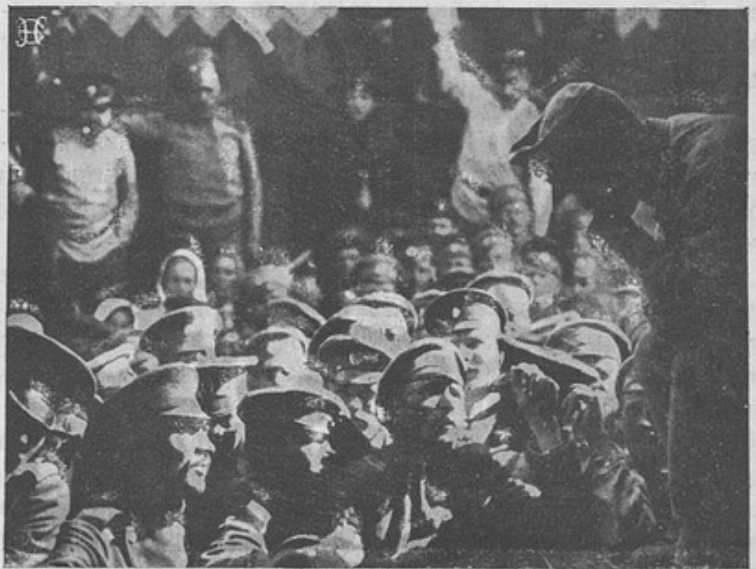
Съ театра военныхъ дѣйствій. Первый австрійскій плѣнный.

25-го октября. Между Сѣвернымъ моремъ и рѣкою Лисъ бой въ теченіе дня былъ менѣе интенсивнымъ. Союзники не только отразили нѣсколько частныхъ атакъ неприятеля въ направленіи на Диксмюде и къ сѣверо-востоку отъ Ипра, но и перешли въ наступленіе почти на всемъ протяженіи этого фронта и въ частности продвинулись впередъ въ районѣ къ сѣверу отъ Мессина. Англичане нѣсколько продвинулись въ окрестностяхъ Армантьера. Германскія атаки между Лабассэ и Аррасомъ были отражены. На линіи между Аррасомъ и Суассономъ серьезныхъ столкновеній не было. Въ районѣ Вайи, а также на правомъ берегу Эна французы упрочили свое передвиженіе къ сѣверу. Вокругъ Вердена и къ сѣверо-западу и къ юго-востоку отъ послѣдняго французы закрѣпили за собою опорные пункты, недавно ими занятые. Сильный туманъ, господствовавшій въ теченіе всего дня какъ на сѣверѣ, такъ и въ Шампаніи и Лотарингіи, стѣснялъ дѣйствія артиллеріи и авіаціи.