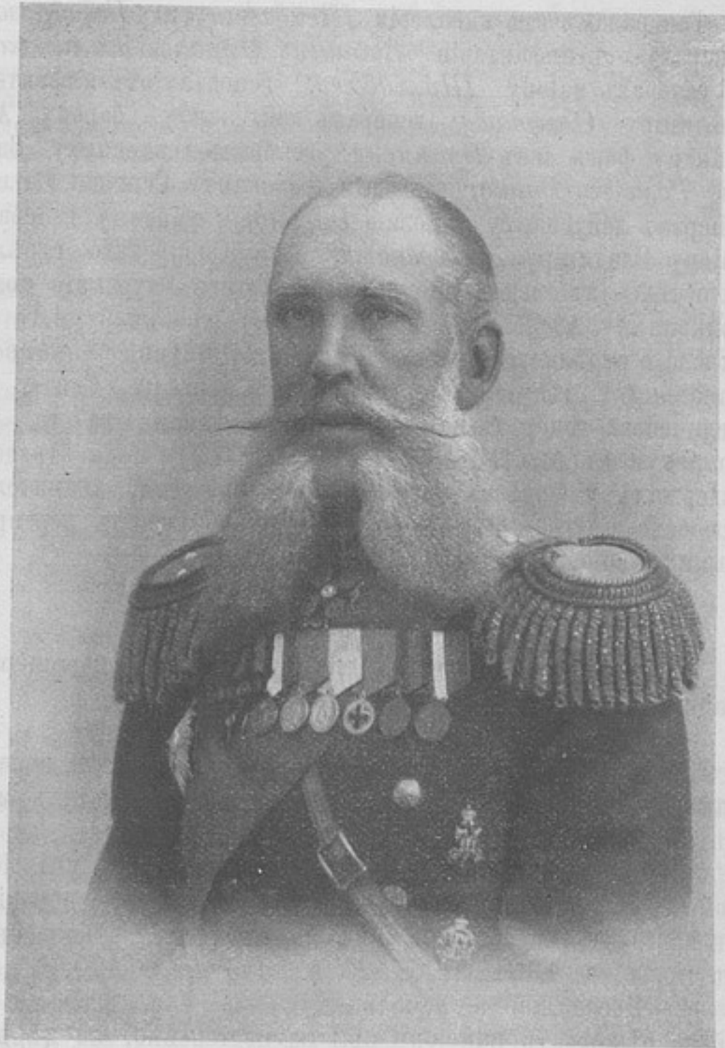
Генераль-лейтенантъ Сергѣй Дмитриевичъ МИХНО,

награжденный орденомъ св. Георгія 4-й степени, за то, что, состоя въ бою 6-го августа подъ Краупишкеномъ ординарцемъ у начальника коннаго отряда, въ самый разгаръ боя, съ явной опасностью для жизни, доставилъ вѣрное свѣдѣніе о неприятелѣ, вслѣдствіе чего были приняты мѣры, увѣнчавшіяся полнымъ успѣхомъ.