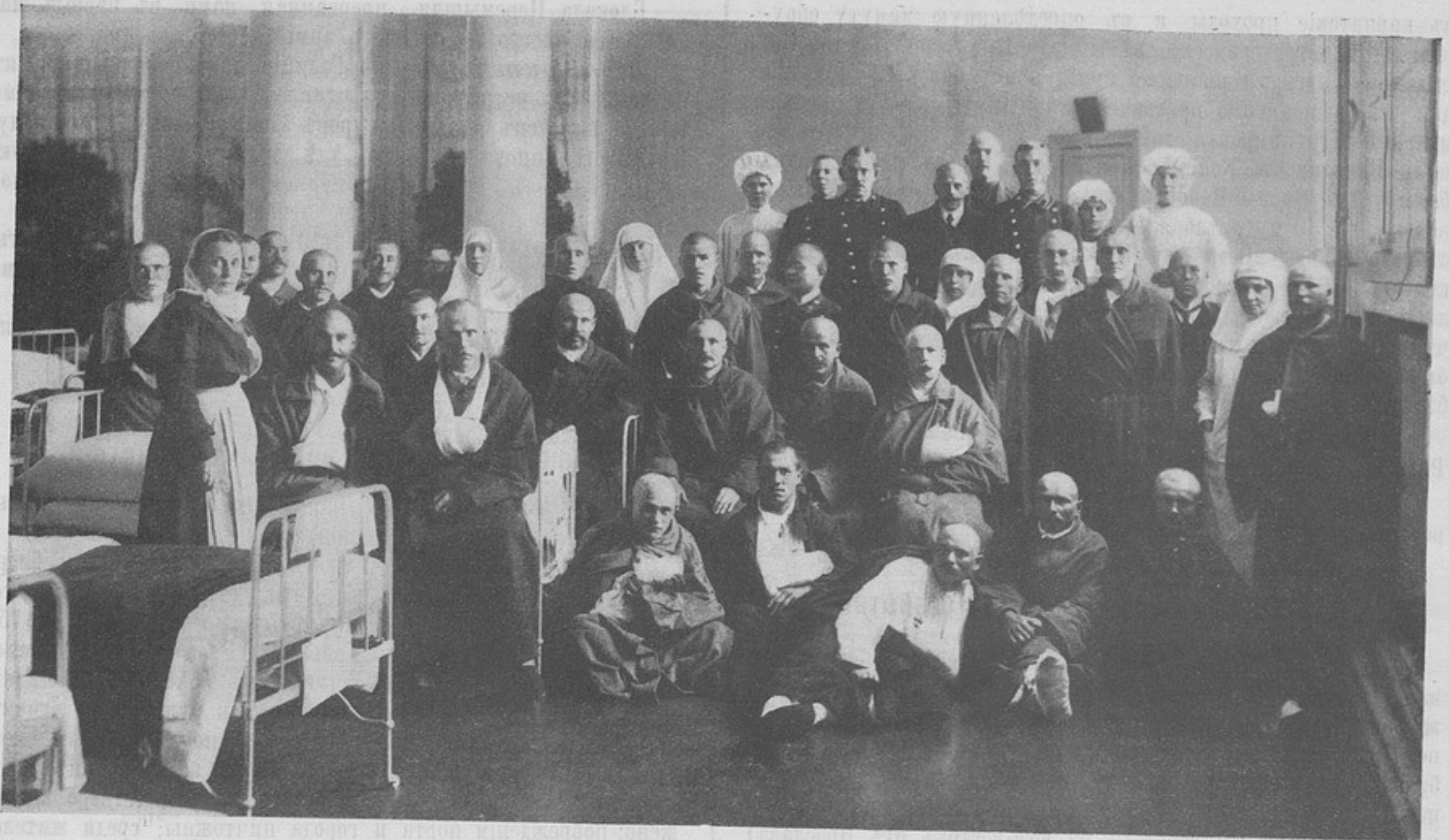
Раненые герои въ лазаретѣ министерства путей сообщенія.

скихъ озеръ. Въ районахъ Гольдапа и Млава—Сольдау происходили успѣшныя для насъ боевыя столкновения.