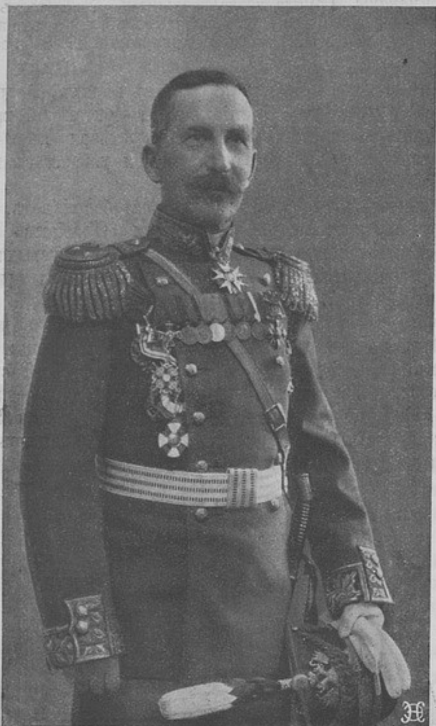
Генераль-маіоръ Сергѣй Николаевичъ ДЕЛЬВИГЪ,

награжденный орденомъ св. Георгія 4-й ст., происходитъ изъ дворянъ Московской губ., родился въ 1866 г. окончилъ 2-й Московскій кадетскій корпусъ, Михайловское артиллерійское училище и Михайловскую артиллерійскую академію. Въ офицеры произведенъ въ 1886 г. во 2-ю резервную артиллерійскую бригаду. Послѣ окончанія академіи С. Н. прошелъ курсъ офицерской артиллерійской школы, въ которой потомъ и служилъ на разныхъ должностяхъ до помощника начальника школы включительно. Въ 1909 г. онъ произведенъ въ генераль-маіоры и назначенъ командиромъ 24-й артиллерійской бригады, въ январѣ же настоящаго года получилъ должность инспектора артиллеріи 9-го армейскаго корпуса. С. Н. участвовалъ въ войнѣ съ Японіей и за боевыя отличія имѣетъ Георгіевское оружіе.