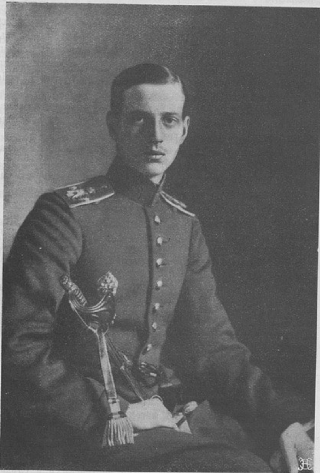
Его Императорское Высочество, Великій Князь ДИМИТРІЙ ПАВЛОВИЧЪ,