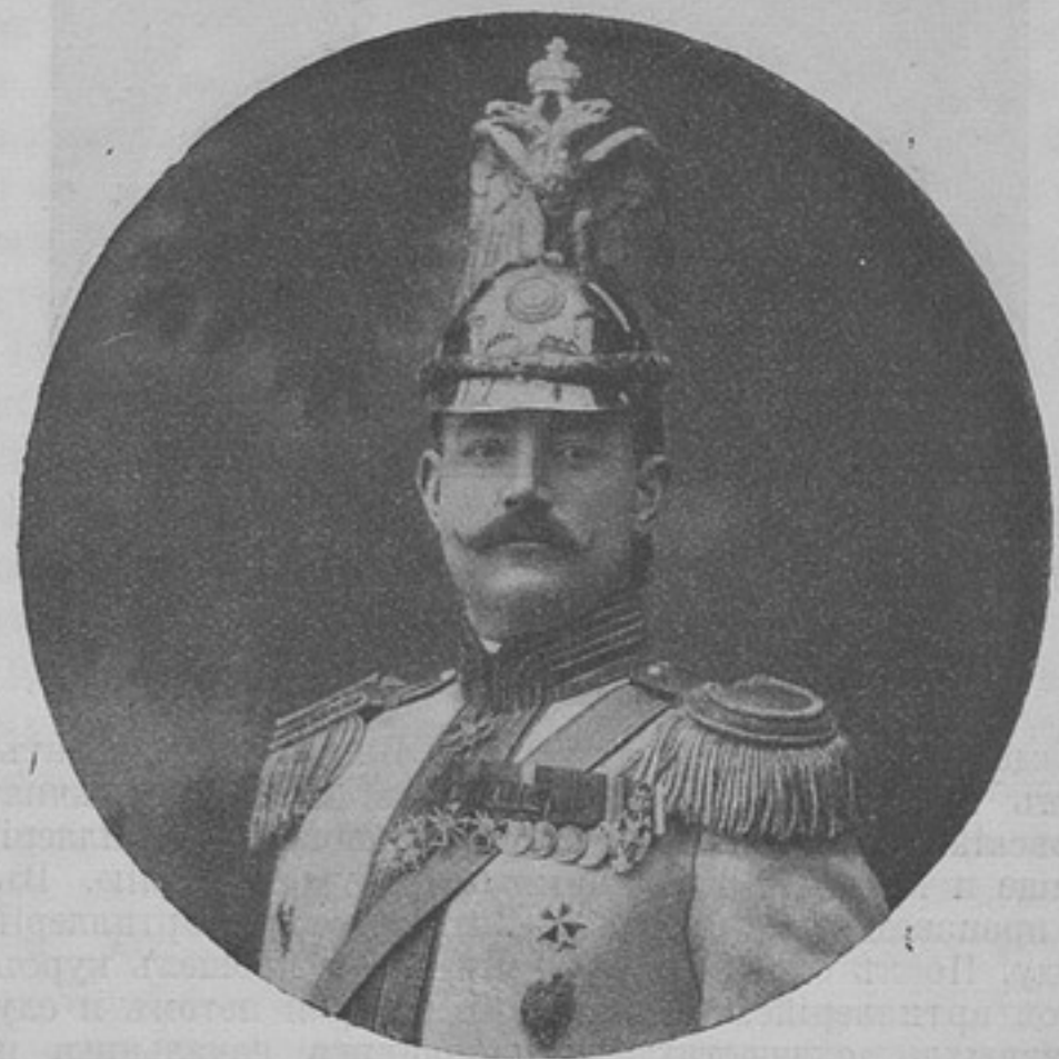
Командующій лейбъ-гвардіи Коннымъ полкомъ, полковникъ

Чтобы воспрепятствовать выходу германскаго крейсера изъ рѣки, въ послѣдней были затоплены угольщики; такимъ образомъ «Koenigsberg» какъ бы арестованъ. Такъ какъ въ настоящее время не приходится уже болѣе считаться ни съ «Emden'омъ», ни съ «Koenigsberg'омъ», то Тихій и Индійскій океаны очищены отъ германскихъ судовъ кромѣ эскадры, оперирующей въ чилийскихъ водахъ.