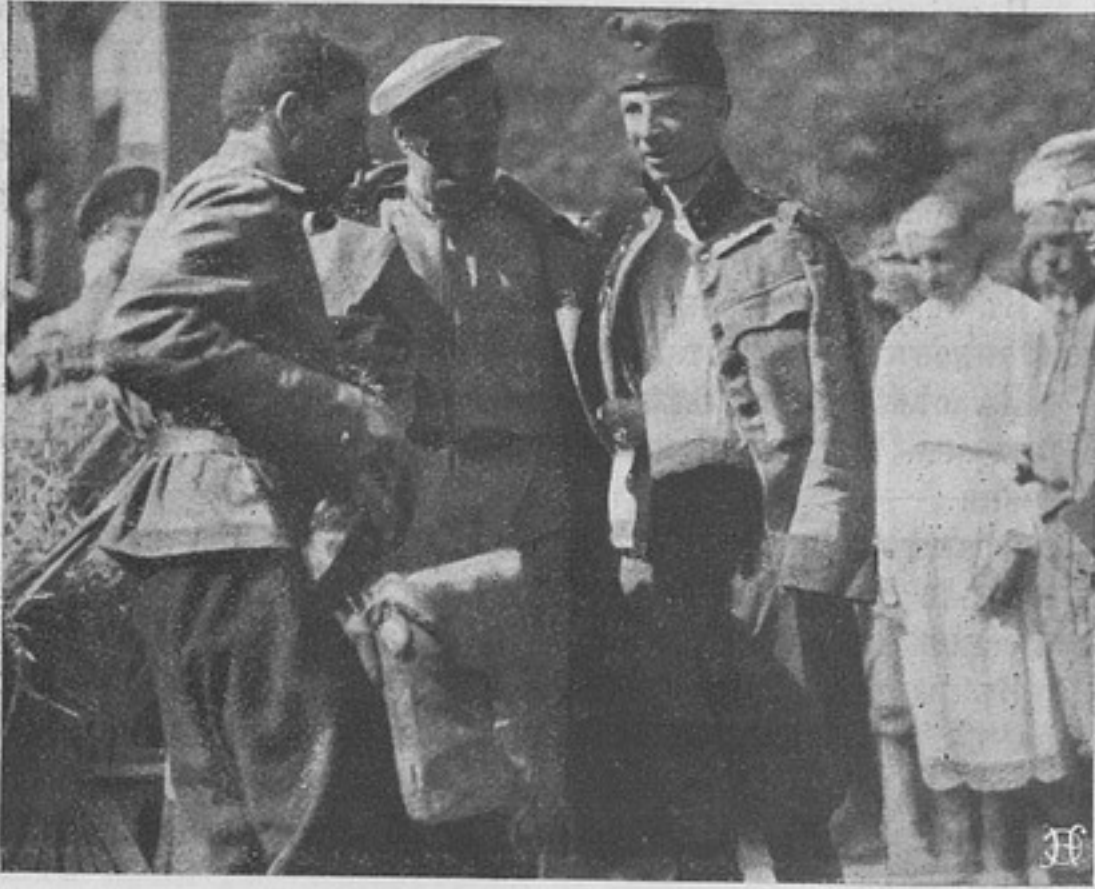
Съ театра военныхъ дѣйствій. Раненый русскій солдатъ, поддерживаемый австрійскимъ плѣннымъ.

Всѣ три, нагруженные обмундированіемъ для войскъ, автомобилями, аэропланами и орудіями, были потоплены. Съ тонувшихъ транспортовъ были подобраны и взяты въ плѣнъ 248 человекъ, въ томъ числѣ нѣсколько германскихъ офицеровъ.