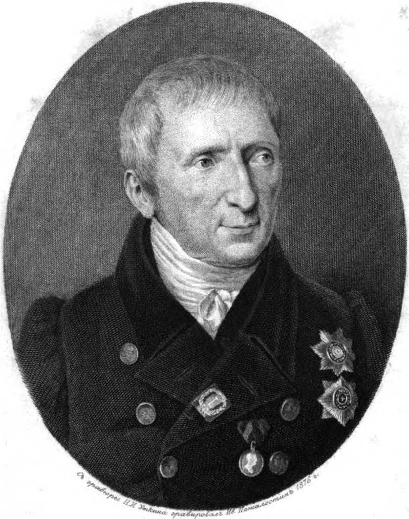
А. Н. ОЛЕНИНЪ.