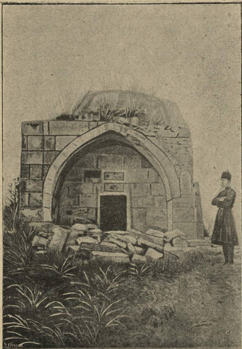
Храмина, гдѣ обрѣтены мощи св. мучениковъ Гаведдая, Дады, Каздои и Гаргала.