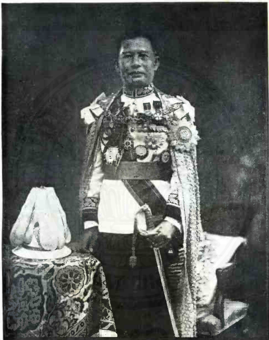
นายพลโท พระวรวงศ์เธอ พระองค์เจ้ากำรบ