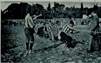
وفا اعدادیسی استانبول سلطانیسی ایله خلطاط چکر ایکن

چونکه ازمیردن کن فوت بولچیلر ایله استا. نیولک اویونچیلری آزمسندله اوج مهم وکوزل مسابقه اجرا ایدلی . و بوسنه مک فوت بول موسمی ده بر آز کچ اولقله برابر پک ای بر صورتده ختمه ایردی . بو