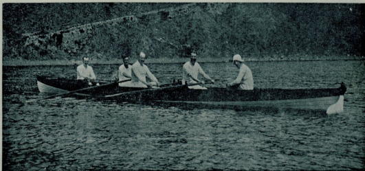
« استانبول شهری » صندال قلوبی ادمان یاپارکن

اوت ، هیمز شاعر ، ایچمزدن بریسی چیقوبده نصل تنفس ایدلرکنی ، نه بولده هضم اولدیغنی ، قلبک نصل اولدیغنی ، صوراجاق اولسه ؛ برچوقلریمزدن جواب آلق نصب اولماز . کیممز عشق و علاقه دن بخت ایدوب « قلبک » : تأثیراتی یازارده ، قلبی دماغی ایله قاریشدریر ؛ قاریشدریرده اونلده نه ییچیم عضو اولدیغنی بیلمز ، کیمی کوز یاشسندن ادیبانه