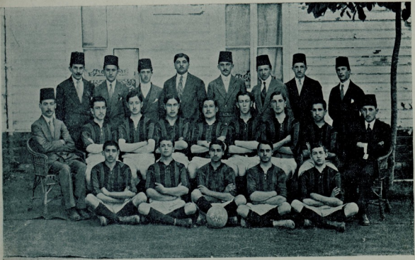
قادر بفتحه ایکنجی فوتبول طاقی

ایکی ماده نك بر لکده ترقیسه چالشمق بر استفاده اولقله برابر بروظیفه و ژیمناستیک ایسه بو وظیفه نك حسن صورتاه ایفاسنه انسانلری موققی قله جق بروسطه در .