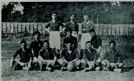
بوكره شهرمز فوتبولچيلرى ايله مسابقه به كيريشن ازميرلى مسافرلرمنز

بو حقيقتدن ، بر زمانلر بوملكت كده - ولوكه قابا سابا اولسون - ايللره محتاج اولميه جق ، حتى قارتى