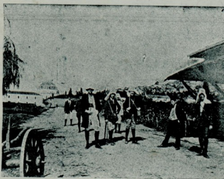
کشافلر ازمیتدن چیقار ایکن

مختلط طاقت بر قصوری ده هیچ برابر ادمان ایتماش اولسی ایدی . او بوخیلرک یکدیگرینه معاونتده وجودی الزم اولان انتظام و اتحاد تام مطلوب درجه موجود دکادی . فی الحقیقه بو ، ازمیرلیره قارشلی یالکز بر قاچ صائی فضله یالسنه مانع اولدی . حال بوکه دهه قوتلی بر خصم ایله اوغرشیرکن کوزل بر برابرلک تقصائی فنا بر نتیجه و بره بیلیر . مع مافیسه بوتون صاغ طرفده اک کردن تایلیری به قدر غایت ائی بر تشریک مساعی موجود اولدیغی کجی مدافعه ده کی او بوخیلر- ده یکدیگر یاه غایت ائی او بو شمشلردی که بوتون بونلر استانبو- لده کی فوت بولجیلرک ترقیاتنه برر برهان بیلغدر .