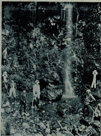
کشافلر بئجه جکده طبیعتک کوزلاکلرندن استفاده ایدر ایکن

مدافعه سنه قوشمشلر - دی . فقط غلطه سرای مهاجم خطک بوتما دی وشدید هجوملری البته بر حسن نتیجه ویره - جکدی . بالخاصه صاغ طرفدن حسنون بک او برله برادرله طوبی کوندریبور ، اونلرده محسن بکن بیکک معا - وتیله قلمه به آتورلر - دی . نهایت حسنون بک حواله ایتدیکی طوبی محسن بک ماهرانه بر ضر به ایله ازمیریلرک قلمه سنه کوندرمه کوموق اولدی . بر آرزوکرده مسابقه ختام بولدی . غلطه سرا بک اوکون