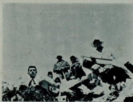
کشافلر ازمیتده کل تپه سنده

مسابقه لری آیری آیری تدقیق و تصویر ایتمه دن اول بر آز هیئت عمومی سندن بحث ایتمک مناسب اولور . اولاکال افتخار ایله سویله بیلیرزکه استانبولک فوت بول اوینایان کنجلی بر تکامل سریع ایله ترقی ایدیورلر . و پک آز برمدت صکره استانبولک کزیده اویونچیلرندن متشکل