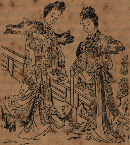
HONG HOE TIANG HOA