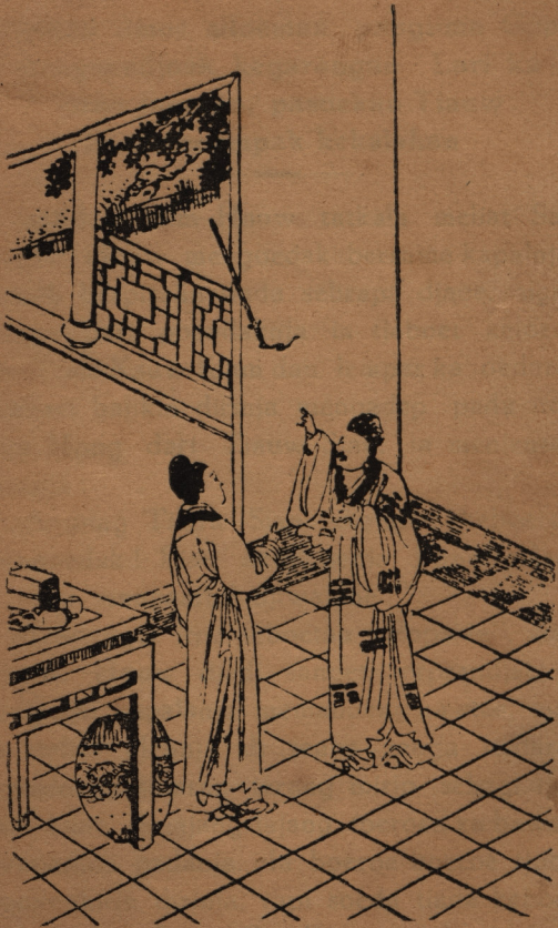
HIM JOE HOK MEMOEDJA PEDANG MENDIRIKEN PAHALA.