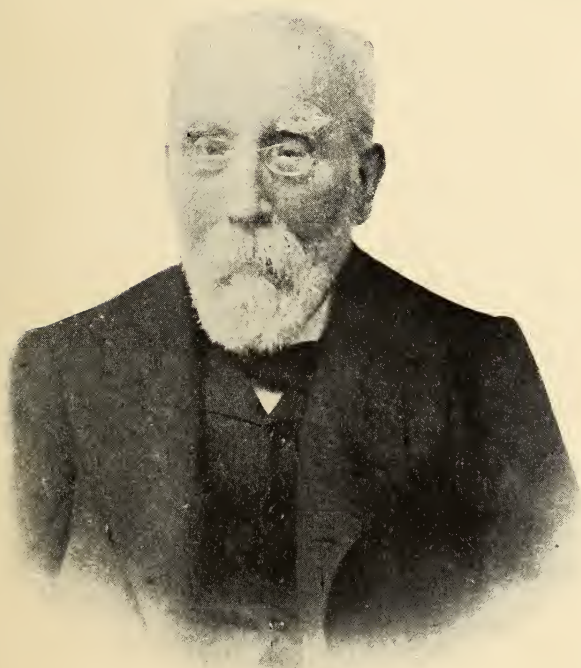
FRANCISCO PI Y MARGALL