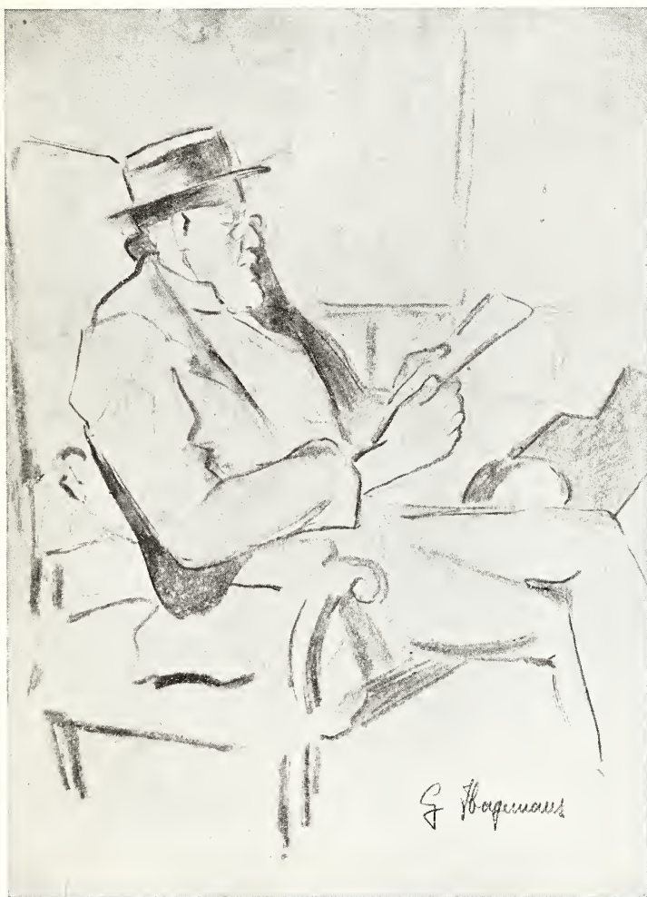
== == CROQUIS, PAR M lle GERMAINE HAGEMANS