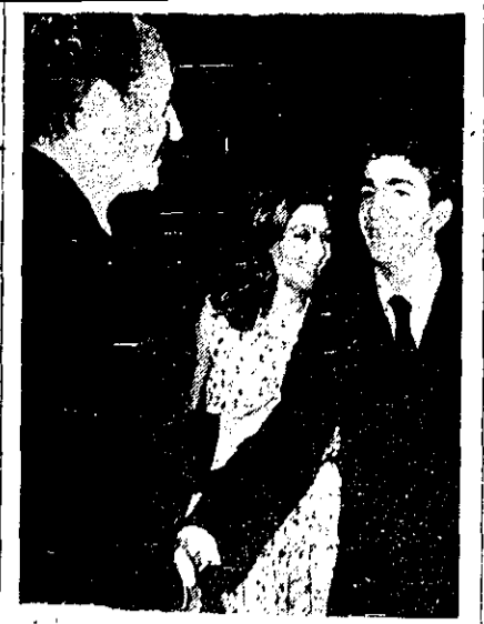
در عکس بالا حضرت ولیعهد در فرودگاه مهرآباد پادشاه اسپانیا خداحافظی می‌کنند. اعطی حضرت خوان کارلوس و ملکه سوفیا پنجمین شب با برقه رسمی شاهنشاهی و شیانو تهران را بقتل برنگزیدند. (شرح در صفحه ۳)