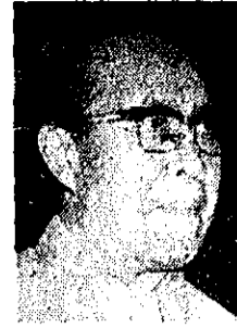
هوانگ هوا وزیر خارجه چین

● هوانگ هوا: کشورهای «جهان سوم» و اروپای غربی باید برای مقابله با شوروی متحد شوند. ● آمریکا در حال حاضر در موضع تدافعی است و لسی روسیه موضع تهاجمی دارد. ● خطر جنگ در جهان روز بروز بیشتر می شود.