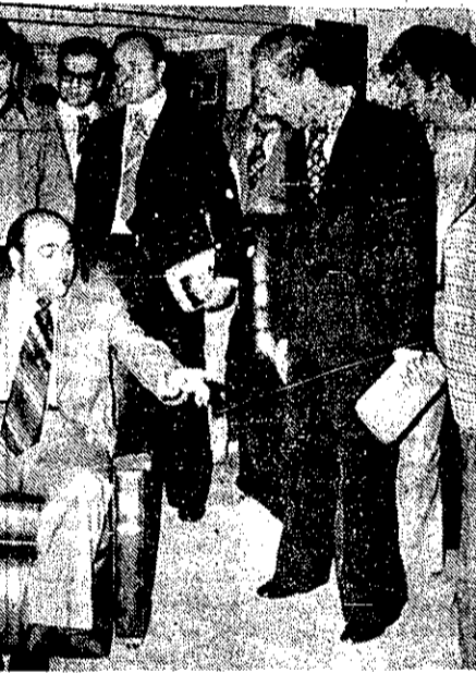
در غرفه شرکت نجکو وزیر بهداشتی و بهزیستی روی یکی از مبلهای طبی نشست و آنرا آزمایش کرد

استقلال و تعامیت ارضی خود به سرچشمه بسیار دیرینه و باستانی دارد و مسای این روابط تمدن و فرهنگ همدیگر راغنی کرده و دوستی خود را افزایش دادیم. در تاریخ معاصر شاهد آن بودیم که ایران برای حفظ حاکمیت