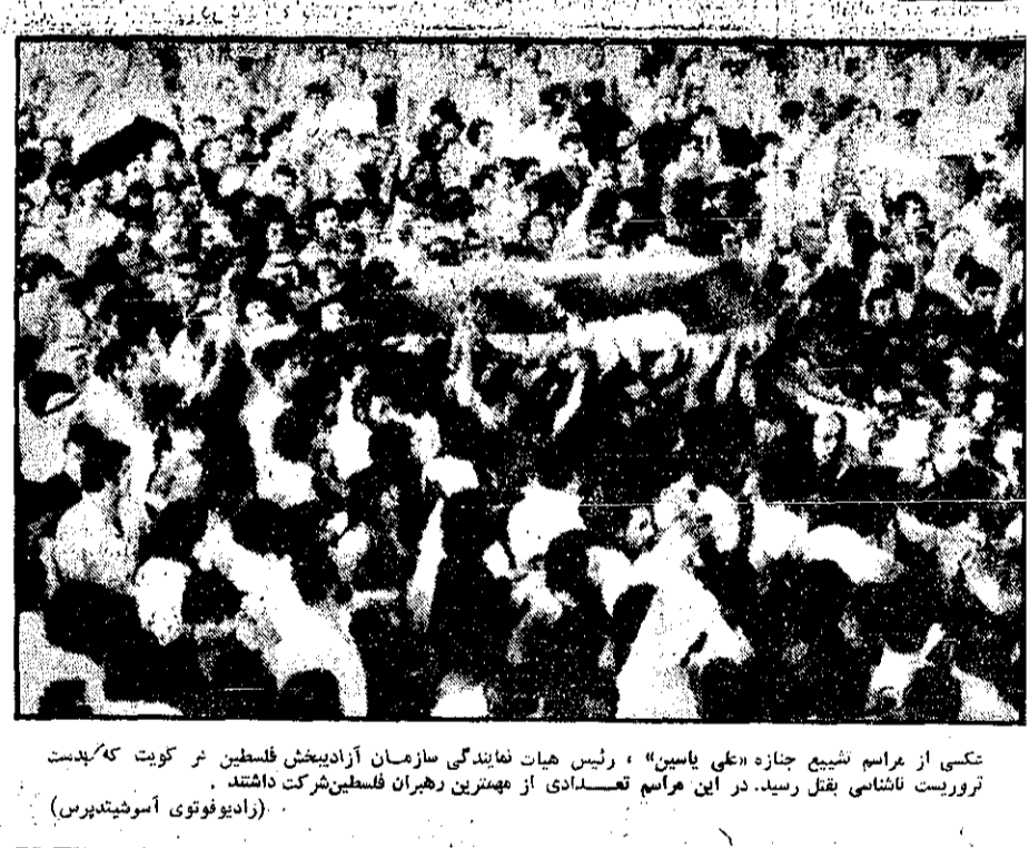
عکس از مراسم شیوع جنازه «علی یاسین» رئیس هیأت نمایندگی سازمان آزادیبخش فلسطین در کویت که به‌دست تروریست‌ها کشته شد. در این مراسم تعدادی از مهمترین رهبران فلسطین شرکت داشتند