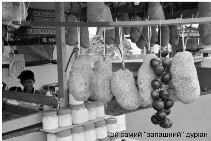
Той самий "запашний" дуріан