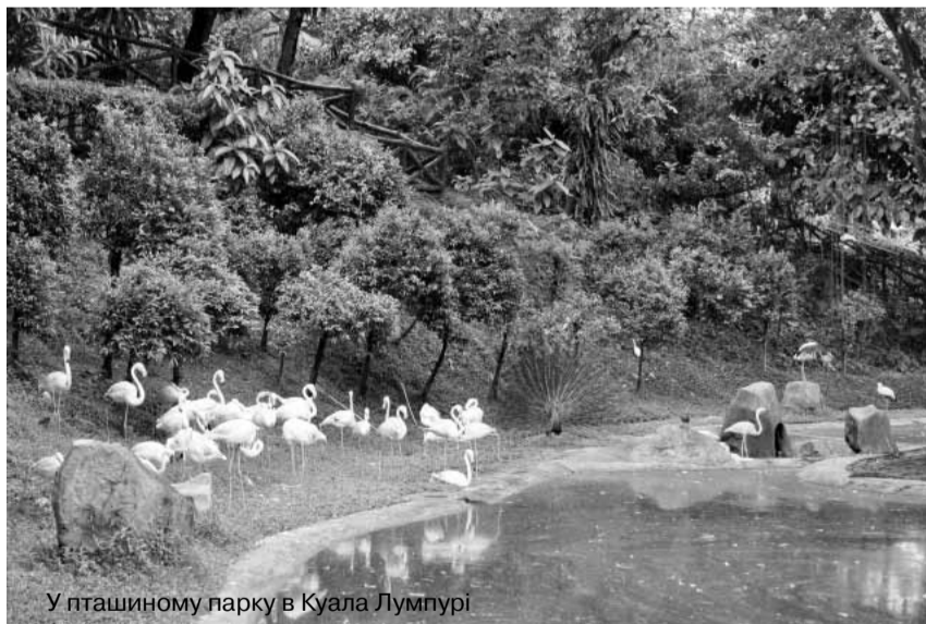
У пташиному парку в Куала Лумпурі

У Куала Лумпурі є дві архітектурні споруди, які можна назвати візитними картками міста. Перша – це телевізійна вежа Менара, одна із найвищих у світі