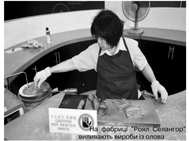
На фабриці "Роял Селангор" виливають вироби із олова

Дуже сподобався похід до саду тропічних фруктів.