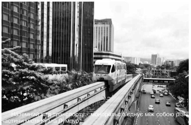
Наземний вид транспорту - монорельс з'єднує між собою різні частини міста Куала Лумпур

Там я вперше дізналася, що період дозрівання ананасів такий, як і у немовлят - дев'ять місяців; переконалася, що банан слід вважати все-таки травною, а мій дідусь побачив, як росте і пахне «король фруктів» дуріан (як часник і тухла риба в каналізації). Спробувати його ми