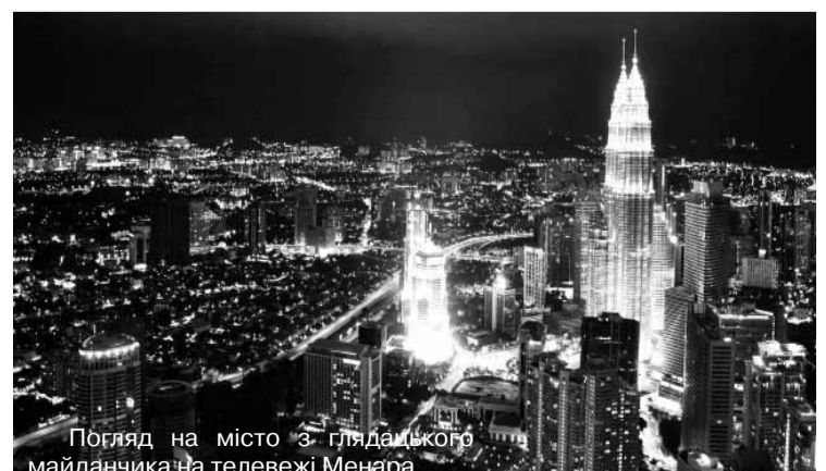
Погляд на місто з глядацького майданчика на телевежі Менара