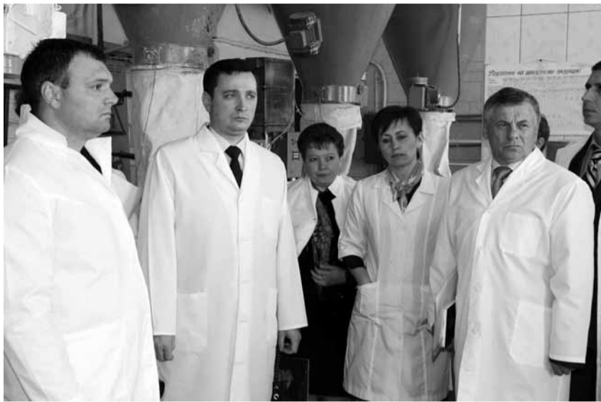
району, нарікали і підприємці, і сільські голови.

- Ще магазин не відкритий, а люди вже біля дверей стоять, - звертає увагу керівництва заводу на важ-