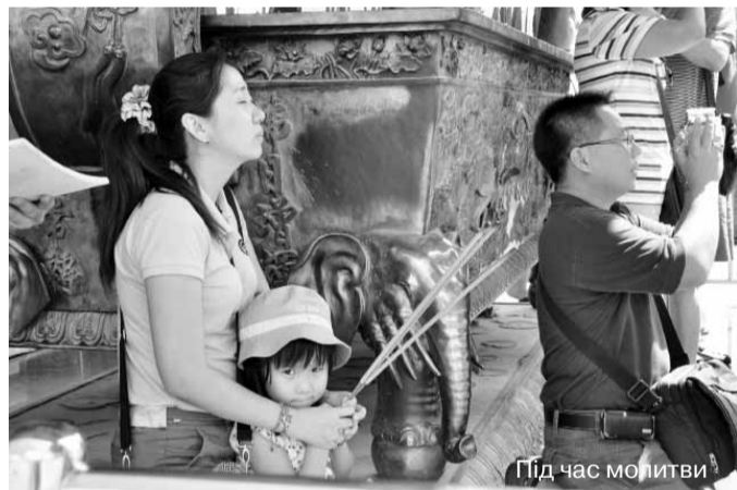
Під час молитви

Стрункими красенями-близнюками милувалися здебільшого на землі, сидячи на лавці у парку, що поруч. На хмарочосах також є оглядова територія, проте ми вирішили, що досить вражень і від телевежі Менара.