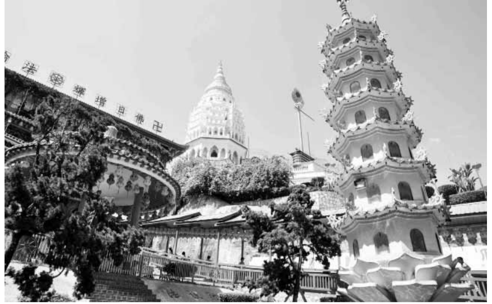
Архітектурні споруди о. Пенанг

на собі жодного тиску чи косих поглядів з боку господарів цієї землі.