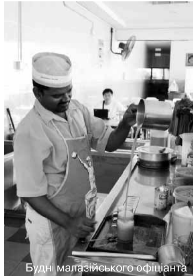
Будні малайзійського офіціанта

Ще однією візиткою міста є вежі-близнюки Петронас. Ці хмарочоси були донедавна найвищими у світі (451 метр заввишки, 88 поверхів), аж поки не з'явився в Об'єднаних Арабських Еміратах «Бурдж Дубай» (понад 800 метрів).