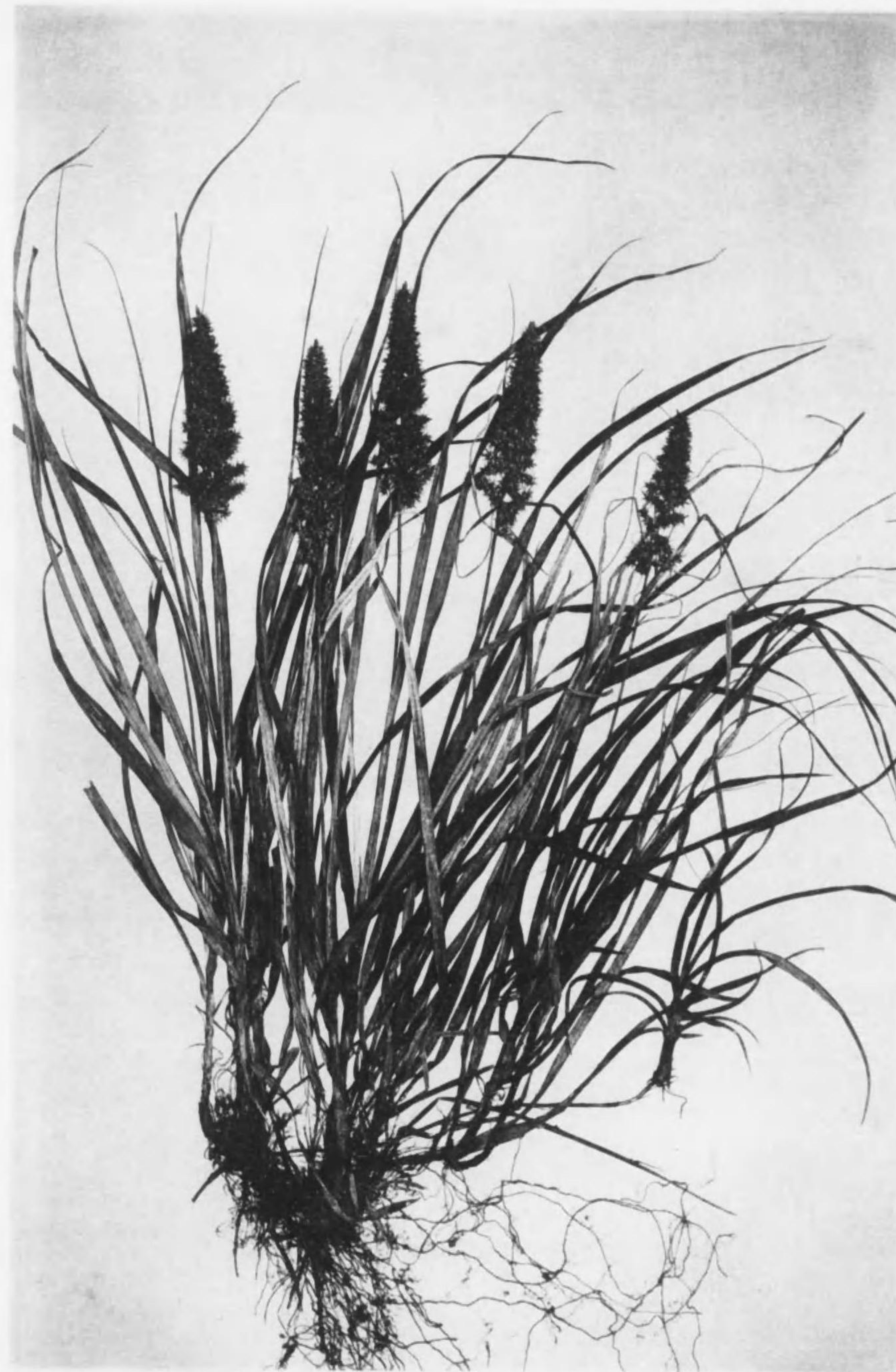
X_{12}^7 Carex satsumensis , Franch. et Sav. あぶらしば (Cyperaceae. 莎草科)