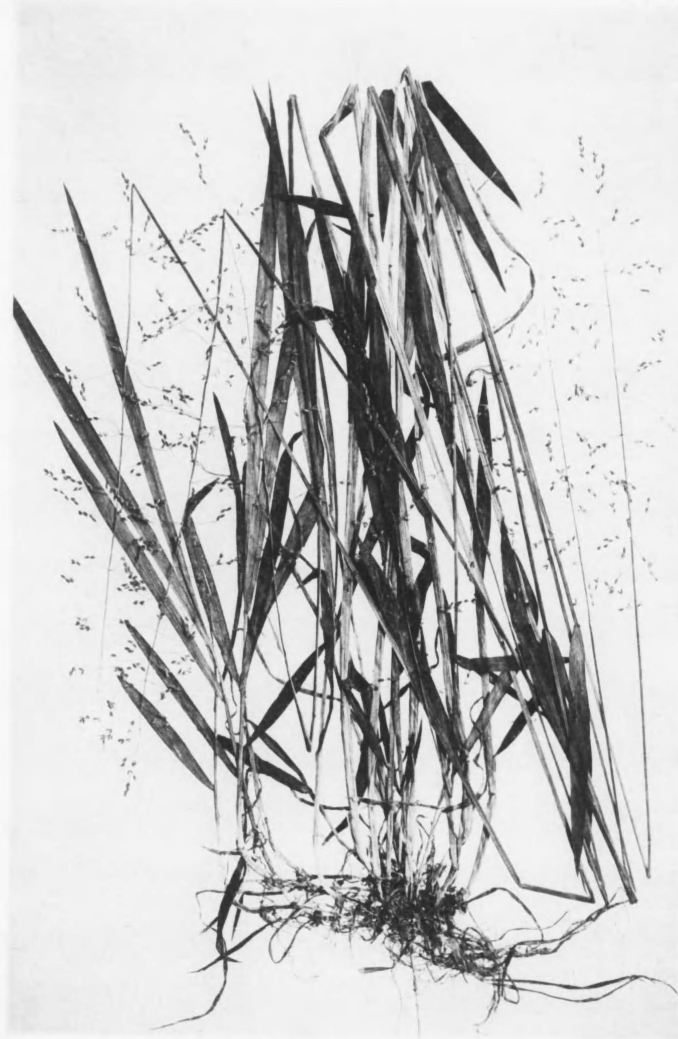
Milium effusum, Linn.