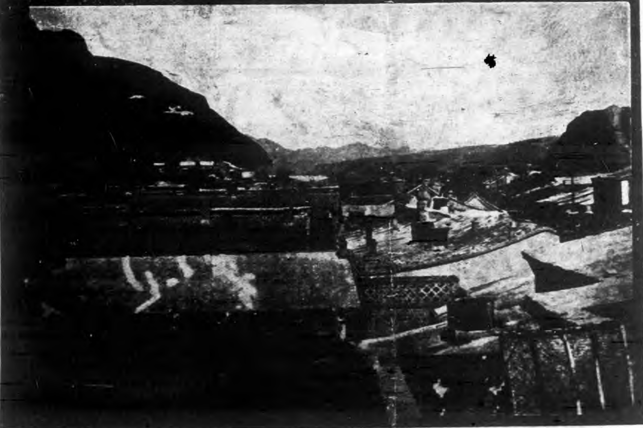
◀ 之形勢。 可觀，圖為張家口上堡一帶新建築 來經當局之努力從事建設，已大有 張家口為我國北方之重要門戶，年