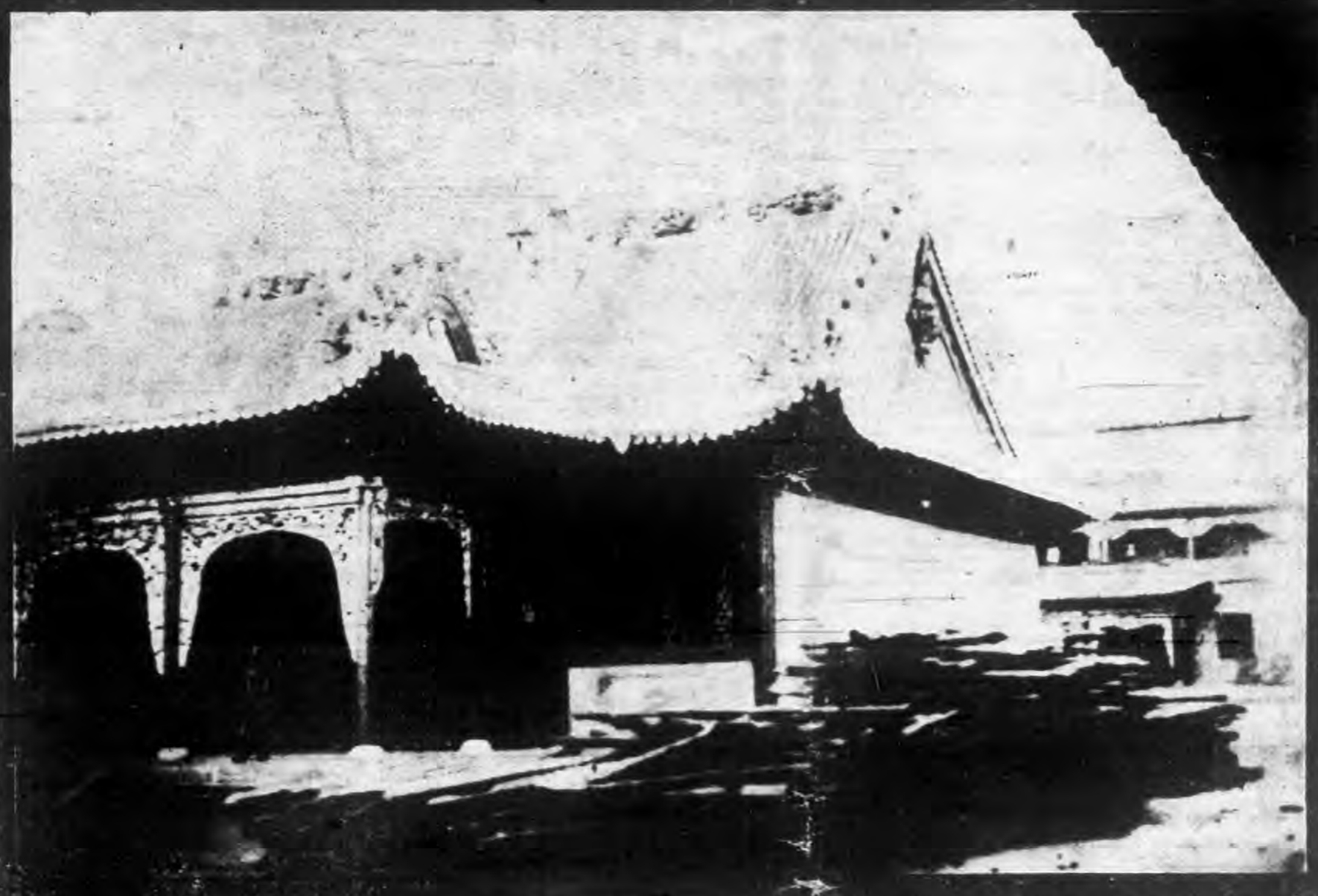
◀ 首新建築一班禪廟，業已落成。 多事聲中之蒙邊，最近在德王府西