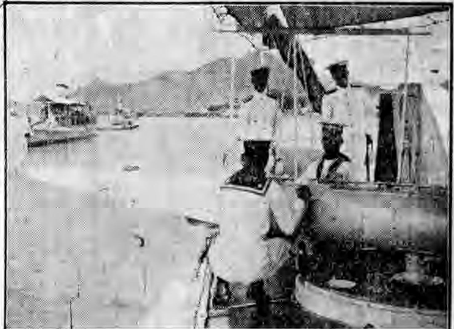
湖軍雷艇操時攝影

同盟東京十一日電 海軍省軍政部與軍令部兩當局，關於明年預算之意見，已經一致，現由經理局長整理數字，預定於十六日以前完畢，可於本週中提交大藏省，海軍預算中有擴充船艦航空，及整備水陸各設備之計劃，共約七億七千萬元，比本年增加二億元。 美一萬萬元海軍工程即