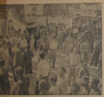
مقدم صفویک واحد از ارتش زحمتگشان اصفهان برای تحکیم حکومت مصدق و شرکت در فرادوم وارد میدان نقش جهان میشود

مصدق بیروز است انکار تریخو امانه و ایال های ملی مردم کشور مانند سیل خروشان که در زمین نشه جریان داشته باشد در ناز بود و نهضت های مردم قوز پیدای کس مردم کشور هرروز بیشتر از روز پیش به طوفان از دست رفته خود آشفته و وحشت و امکنی برسانه در افکار و اعمال مردم کشور ایجاد میکند و دیگران برسانه که تقیه درصده