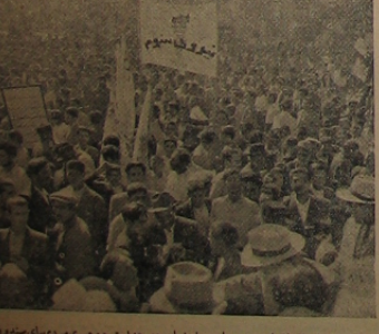
مردان هزار از افراد حزب ما در اصفهان و در هیات وزه ای مردم اصفهان ها نقش فعالانه ای داشتند و با کوشش آنان اصفهان پایگاه نهضت ملی ایران شده است . تقیه درصده

کنکو کار امروز از روزنامه‌های پیشته وجهه تپه شده است که درج آن در شماره دیروز بابت تراکم اخبار ممکن شده