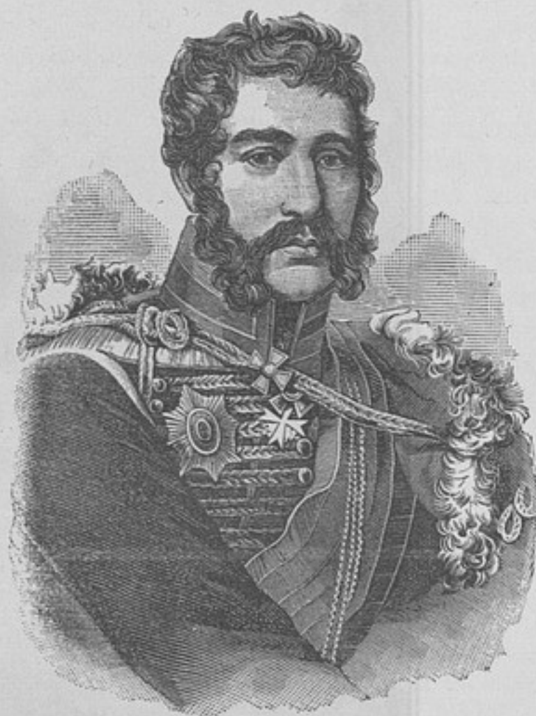
Генераль Яковъ Петровичъ Кульневъ.