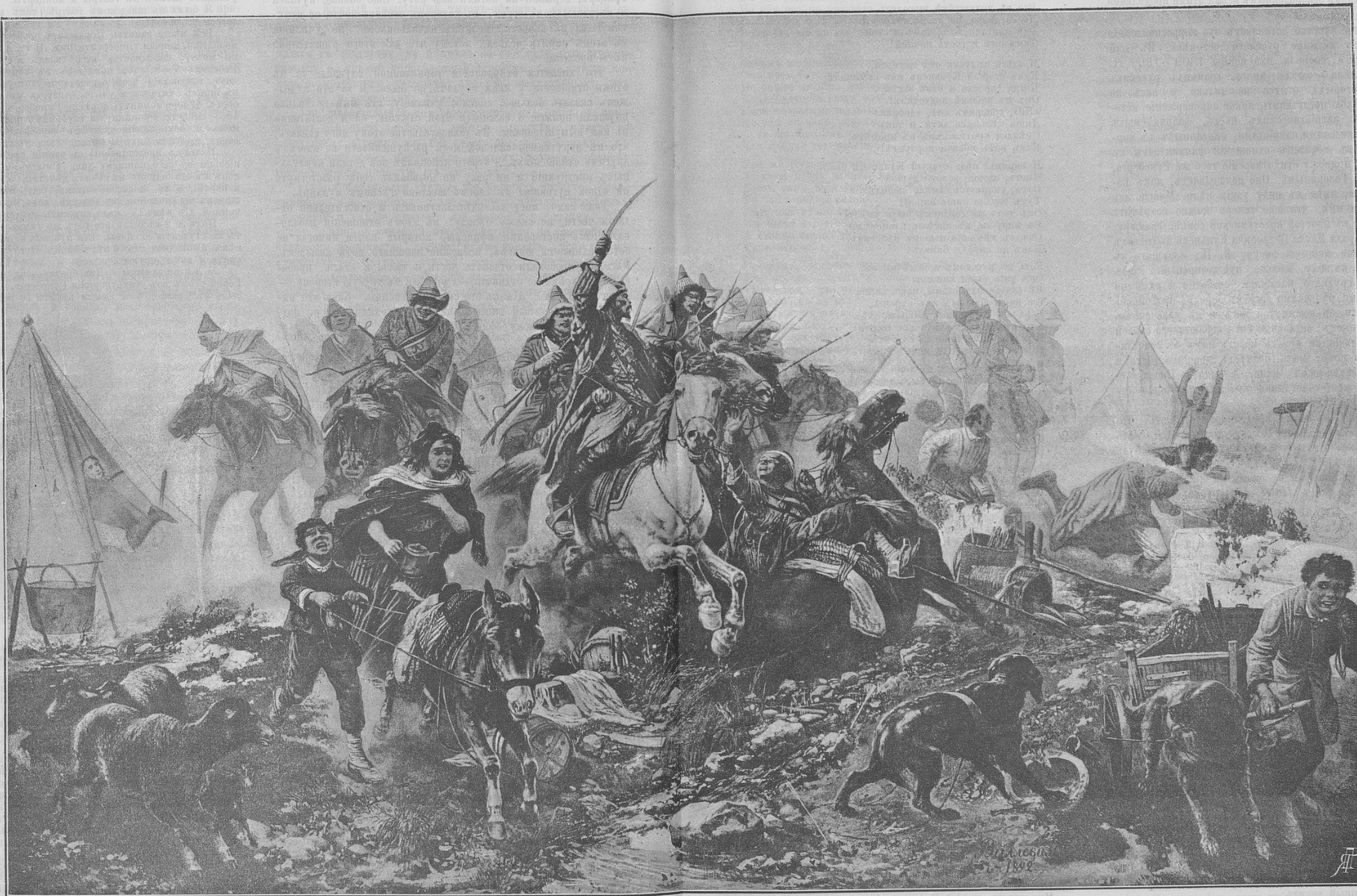
Баширы атакуютъ непріятельскій лагерь около г. Дрездена въ туманное утро. (Сюжетъ изъ 1813 года). Картина профессора Г. II. Виллевалде. Выставка Императорской Академіи Художествъ 1893 года.

бросью и прямою этого побѣжденнаго и, размягчившись, отказывается моментально отъ всѣхъ кровавыхъ желаній и съ благодарностью, не будучи въ состояніи выговорить хотя бы слово отъ полноты нахлынувшихъ чувствъ, жметъ руку и, кивнувъ головою, летитъ съ такою же стремительностью прочь.