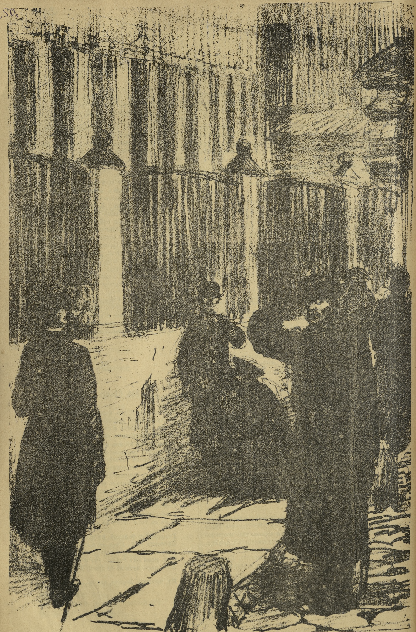
У входа въ храмъ науки.