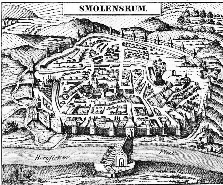
Смоленскъ въ эпоху Сигизмунда III (1611—1632).

Съ избраніемъ въ 1613 году на царство Михаила Ѳеодоровича Романова, подъ Смоленскъ отправлено было войско московское, подъ начальствомъ князя Д. М. Черкаскаго, который взялъ Вязьму, Дорогобужъ, Бѣлый и осадилъ г. Смоленскъ, но взять его не могъ и отступилъ. Война съ переменнымъ успѣхомъ продолжалась до 1615 года, а въ этомъ году въ деревнѣ Деулинѣ заключено было перемиріе на 14 лѣтъ и 6 мѣсяцевъ, по которому Смоленскъ, Бѣлый,