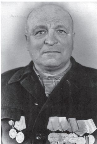
Використано матеріали: І.Кулик «Вистояв у всіх випробуваннях», газета «Радянське село», 1993 р.; домашній архів сина П.О.Савенка — Андрія Петровича.