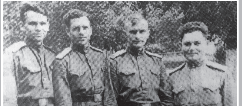
Використано матеріали: Юрій Онищенко «Красивих воєн не буває», газета «Радянське село», 25 вересня 1996 року; власний архів.