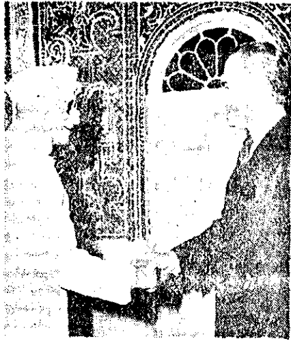
خوارجی دسای نخست وزیر هند چند ماه پیش در سفر کوتاه خود در تهران بحضور شاهنشاه رسید و مذاکراتی در زمینه توسعه همکاریهای دو کشور انجام داد.

اولین دور مذاکرات رهبران ایران و هند بعد از ظهر امروز در دهلی نو شروع شد.