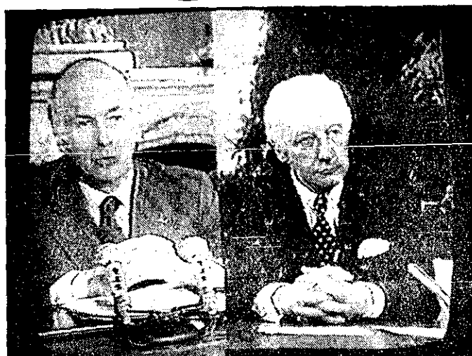
والتر شل (سمت راست) و والری زیسکار دستن رئیس جمهوری فرانسه با دقت به پیام شاهنشاهی آریامهر که از طریق ماهواره سنفونی توسط تلویزیون بخش میسود گوش فرا دادند.

ویژه از آن جهت است که تکنیک و دانش پیشرفته ما هر روز با سرعت و به یک اندازه تغییر می‌کنند اما انسانها نباید تنها عامل این پدیده‌های فنی شوند. دانش سیاسی لازم است که این تکنولوژی پیشرفته به راهها و هدفهای صحیح رهنمون شود.