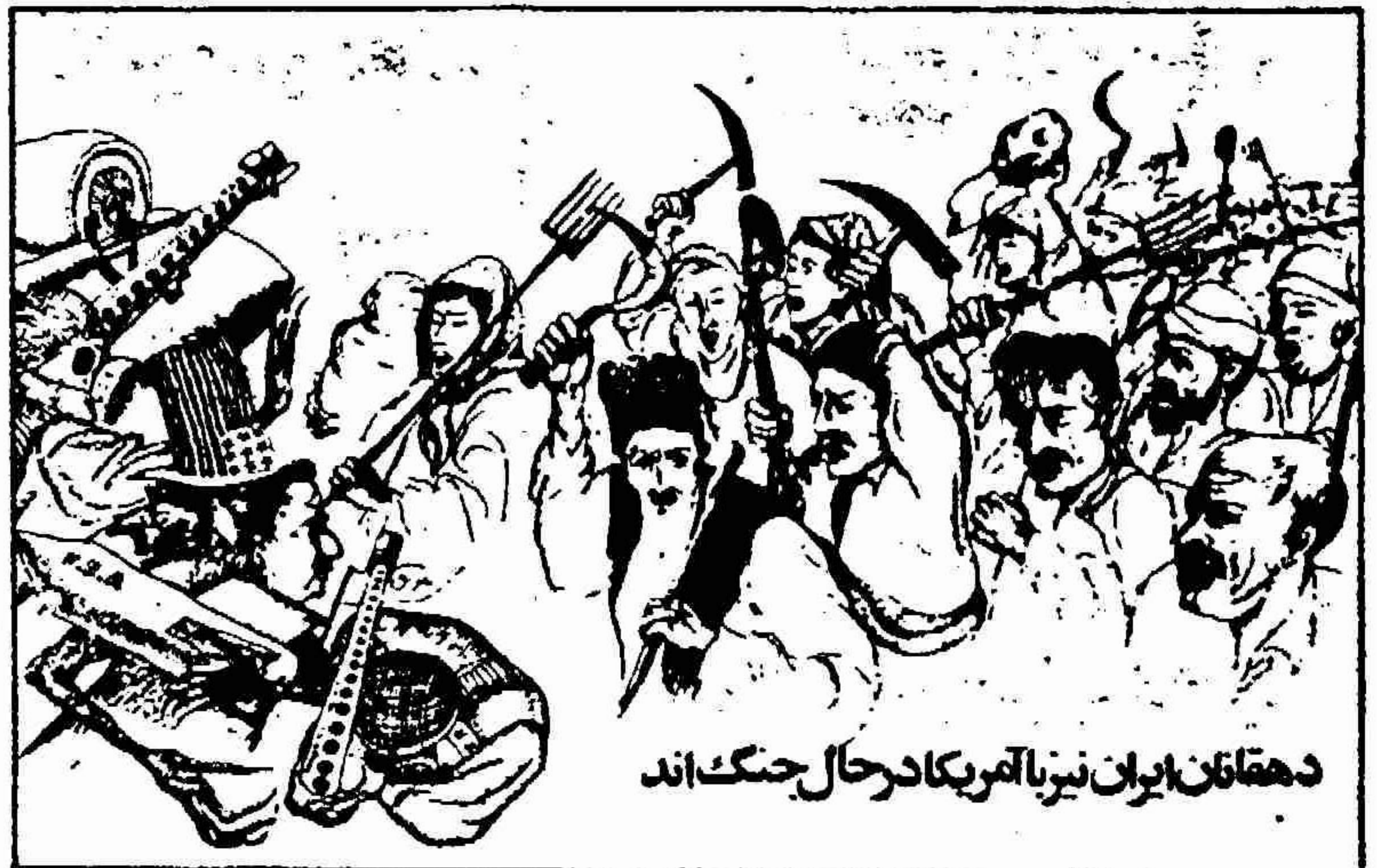
دهقانان ایران نیز با آمریکا در حال جنگ اند