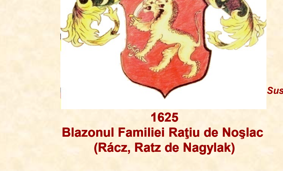
1625 Blazonul Familiei Rațiu de Noșlac (Rác, Ratz de Nagylak)

Lăsământ cărui generalitate vitoare „Tot omu-i pieritor, dar nu-i și-n lume răitor! Iar voi ce Răței și țineți, ai fost și în voi Răței și rămanei! Pomul familiei cu stinținea săi țineți și urmașilor urmașilor voștri să-i transmiteți! Acum și pururea și în vecii vecilor. Amin!”