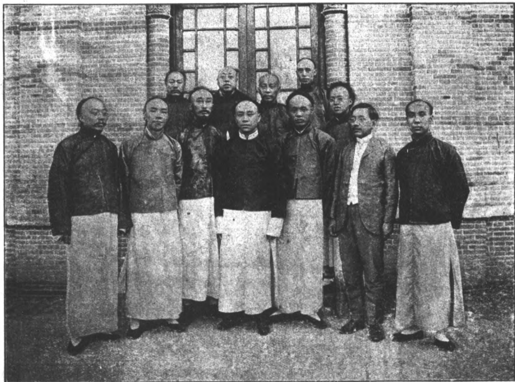
南洋第一勸業會事務所職員合影