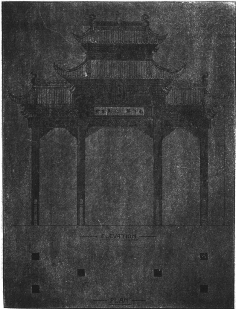
南洋第一勸業會會場牌樓圖樣