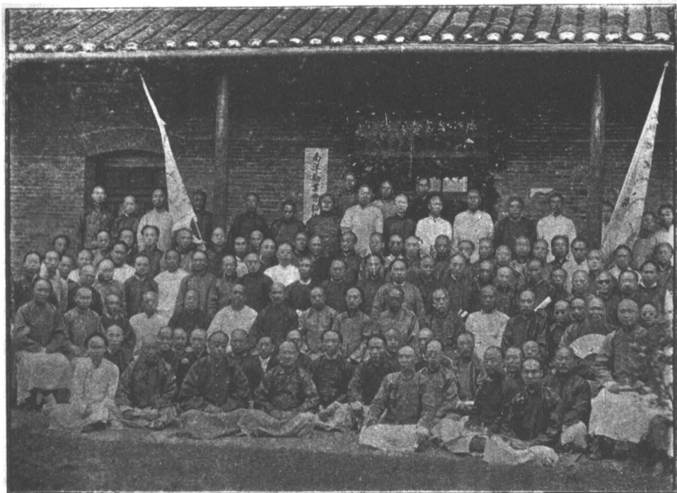
事務所招待江蘇議員合影