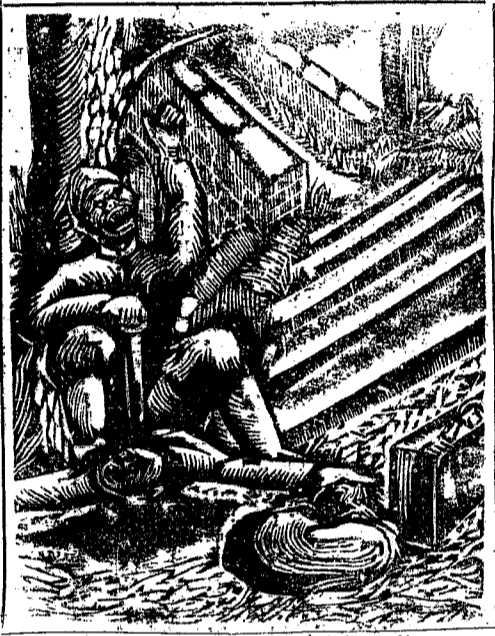
我們需要安排軍隊，打擊鬼子，給難民同胞復仇！

在玉屏縣的街市，從車站到城裏，到處是車馬，到處是車馬，到處是車馬。在玉屏縣的街市，從車站到城裏，到處是車馬，到處是車馬，到處是車馬。