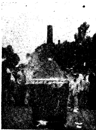
李公樸先生遺體火葬