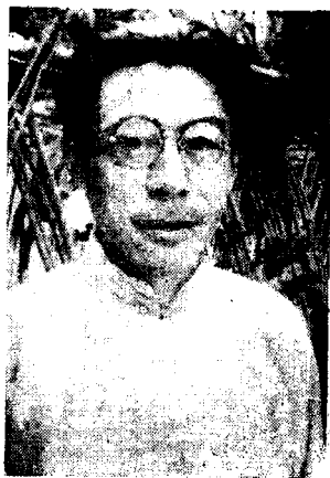
个像的生先多一開後利勝