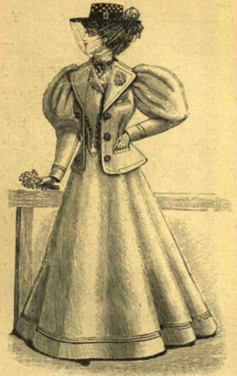
[ صوك موده ]

مهربان او بويورمیدی؟ خیر. ظلمتک ثقلتی، کیجهنک بار دهشتی التنده حسسز، اذعانسز بر حالده یاتور؛ او بقوده اولان کنسیدی دکل، اقتدار طبیعی مدافعهسی، قابلیت معنویسی، هویت نسوانیسی ایدی. مهربان بوکیجهنک ایچنده براوغولتی کی دریندن درینه ظهور ایله وهم وشبههینی ارتدیران سسلره قارشیی قورشون ثقلتنده اولان کوز قباقلری آچدینی زمان، اوکیجهدن سیاه، اسن روزکاردن وخیم، اوتن باقوشدن مصیبت آور، اوچوشان یاسلردن سسسز بر آدم پنجره دن کبریوردی. هر طرفندن عشرت تعفن پایدن بو آدم ایچری کیر کیرمز لزومنده سلاح مقامنده قوللامق اوزره ایله براسکملهینی طونهرق کوچولمش قیزارمش کوزلریله یتساغه باقدینی زمان مهربان تتره یرک «آمان» دیدی. بروح مضطربک مالمال تأثرات اولان بو فریاد عمیقته هر درلو حس و مزیتدن عاری بر قوه قاهره حیوانیه «بن بوقی... هانیا...» جوابی وریوردی.