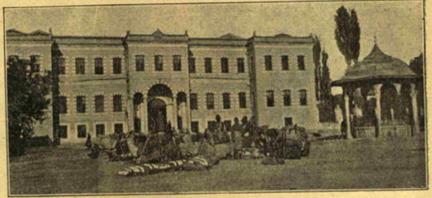
[ خصوصی فوطوغرافیزدن ]

ایکی اوطه دن عبارت براویکز اولسونده سزک اولسون ! قاینک حلقه سنی چالارکن حیزلی اورمقدن قورقاملی ، کچ کلدیگکز ایچین اوشاغک صورت ایده جکنی دوشو - نمه ملی ، اویکزه کیرنجه برلر آباغکزک آلتده تره ملیدر ! « چوجوق سوزلرمک معناسی لاقیله آکلادی ، قیزی طیشاری به آلفه راضی اولدی . سکز سنه دن بری دیرلک ایدیورلر : پک بختیاردرلر . فرنکلری کورمیورمیسکز آجام ؟ یوزده طقسان طفوزی حتی یوزده یوزی قیزی اولندیره جکی زمان آری بر داتره تشکیل ایدر : قاری قوجه تنهایاشارلر ، آبابا کنیدیلرینه مسافرکلیر . — بومطالعانک اساساً طوغرو اولدیغی انکار ایدهم ، فقط هر قاعده نک بر استتاسی