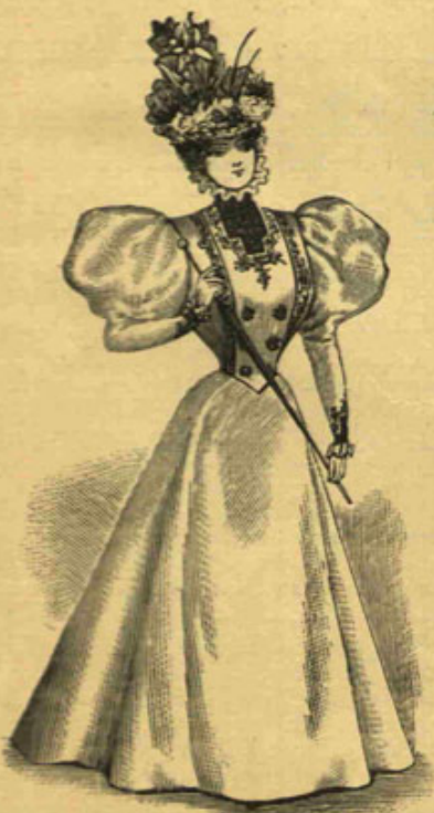
[ صوك موده ]

حدتدن، یأسندن طوکه قالدی. اک اول ذهنته کلن نی، یا اوغلی قبول ایدرسه!... هر طرفه قوشه رق «حتی! حتی!» دیه اوغلی چاغریوردی. یاننده کی شین قره حصارلی خدمتچی غایت ساده دلانه برطور ایله «قادیم میخانه یه آدم کوندرسه ک؟...» دییوردی. میخانه ده دکل قهوه ده ایدی. چا کتنک یاقه سنی دوزلته رک ایچری کیروب حاله واقف اولنجه کمال شدت و متانتله قطعیاً رد ایدیور و کنیدیسندن اولدیغنی هین ایله تأمین ایلوردی. والده ایله خدمت حقیر و ذلیل اوله رق برده اوتوران مهربانک اوزرینه هجوم ایله دوکیورلر، ایچریدن خسته «آچقلر! قیزی اولدیره جکمیسکز؟» دیه فریاد ایدیوردی. او آنده حتی بکلک