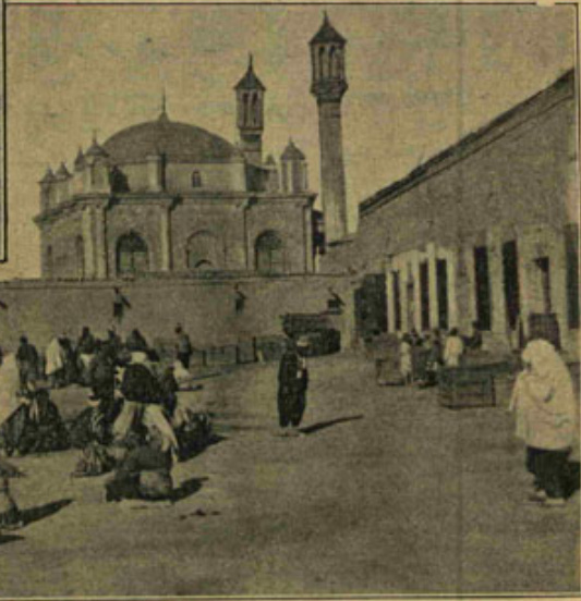
[ قونیهده عزیزیه جامعشریفی و بازار ] La Mosquée Azizié a Konia

اینی کوتوبر نومرو ویردیلیر ؛ فارسی امتحاننه کچلیدی . اولو فارسیدن ترکیجه بر ترجمه یاپدی برلدی ؛ بو « بوستان » دن