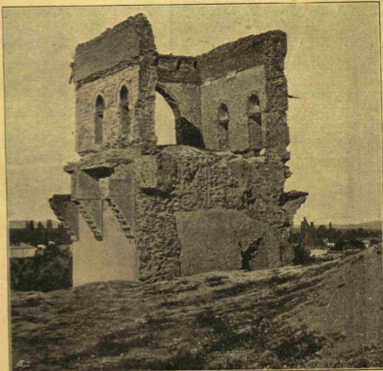
[ خصوصی فوطوغرافیزدن ]