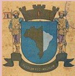
Santana de Parnaíba-SP