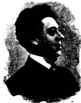
М. И. ВАВИЧЪ.