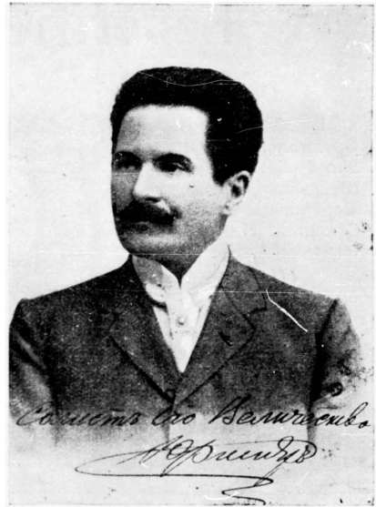
Н. Н. Фигнеръ.