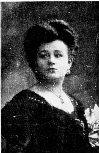
М. А. ЭМСКАЯ.

Изв. баритонъ Московск. оперы. Новый репертуаръ.