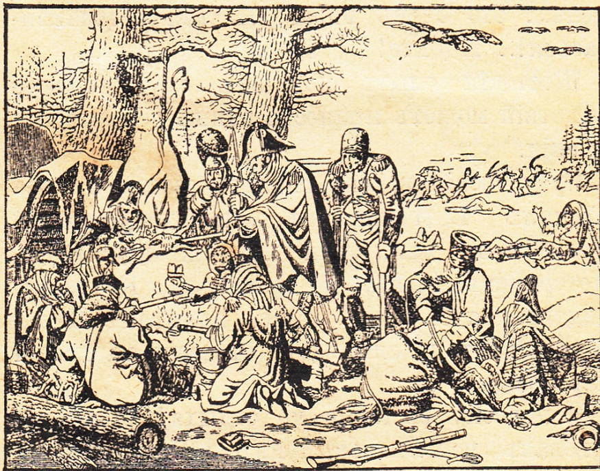
Французы близъ Березины.

Наполеонъ исчезъ съ поля битвы подѣ Краснымъ и, оставивъ на произволь судьбы остальное войско, самъ поспѣшилъ на большую дорогу къ Вильнѣ, въ сопровожденіи кавалеріи (на которой лежала забота приккры-