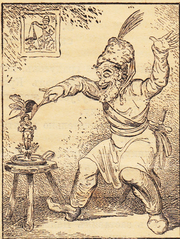
Казакъ, гасящій Наполеона. (Карриатура Терebeneва).

Вскорѣ послѣ казаковъ, у Смоленска показалась и русская армія. Наполеонъ торопливо выступилъ по направленію къ Красному.