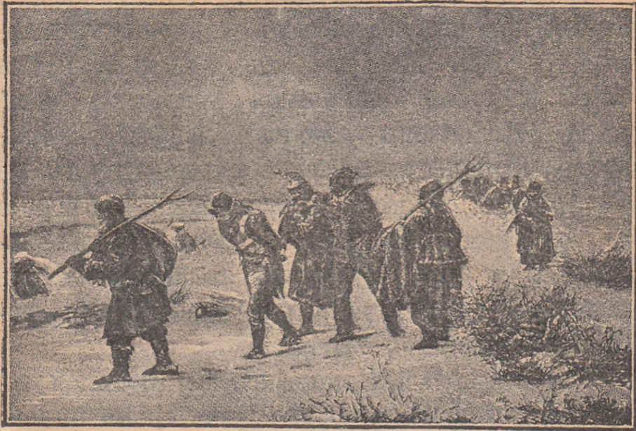
Мужики и бабы сопровождают плѣнныхъ французъ.

Плѣнныхъ было такъ много, что на нихъ не обращали уже вниманія. Ихъ или забирала задніе полки, или отдавали крестьянамъ гуртомъ для дальнѣйшаго препровожденія внутри Россіи. Плѣнныхъ даже не охраняли, не стерегли.