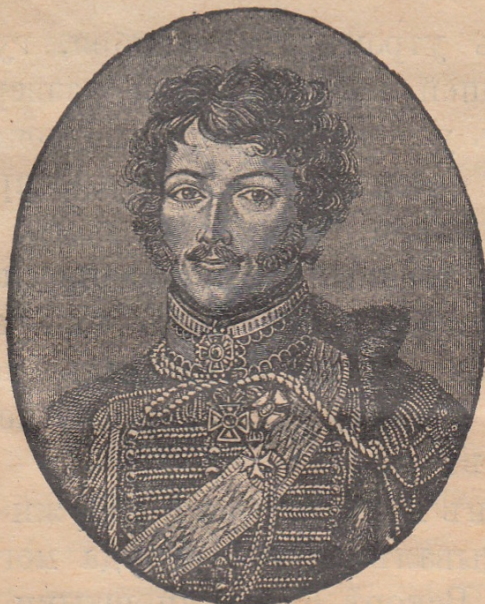
А. Н. Сеславинъ.

Узнавъ объ этомъ, Кутузовъ немедленно отрядилъ туда корпусъ генерала Дохтурова и рѣшился вслѣдъ самъ двинуться съ ар-