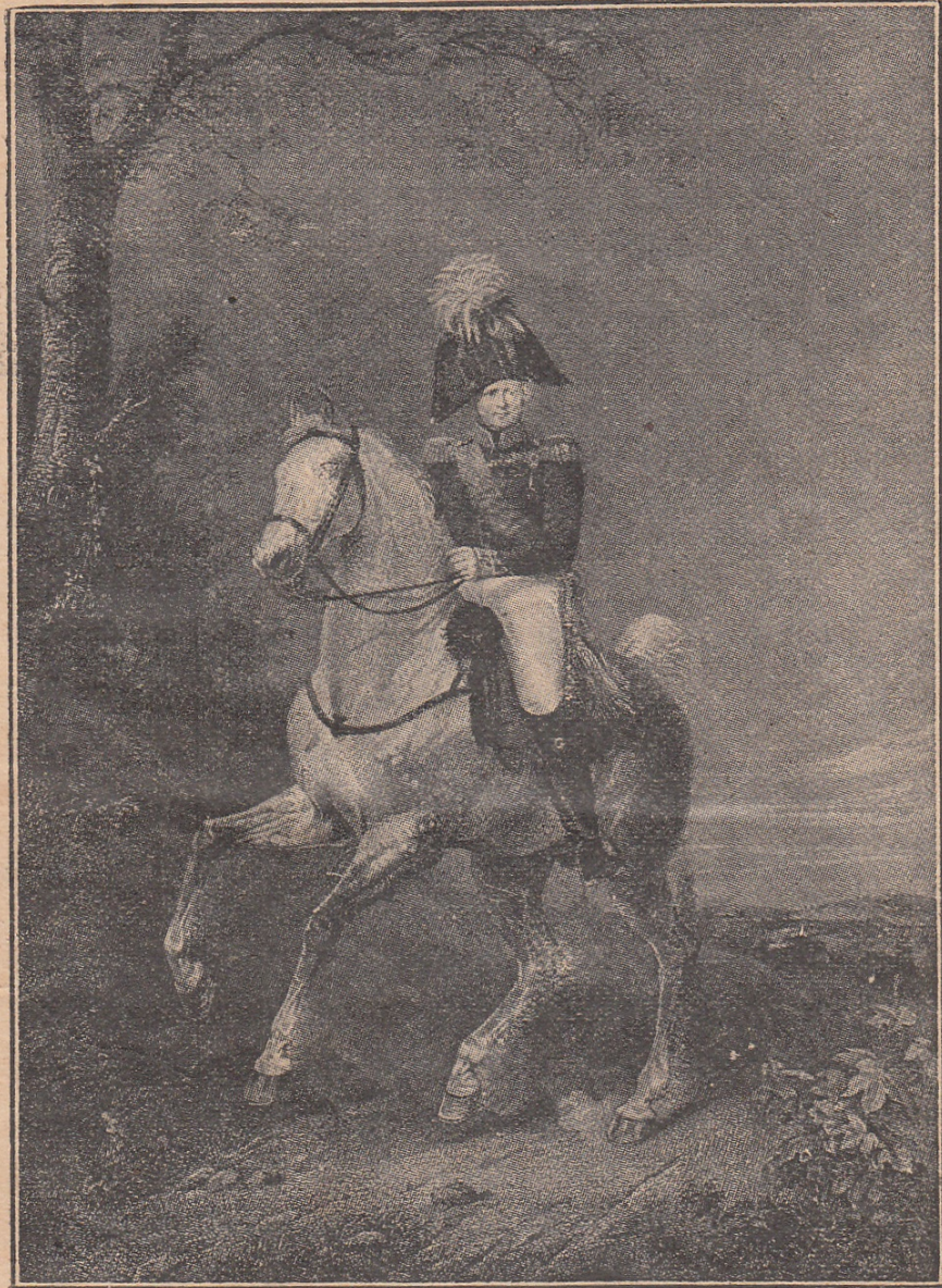
Императоръ Александръ I.