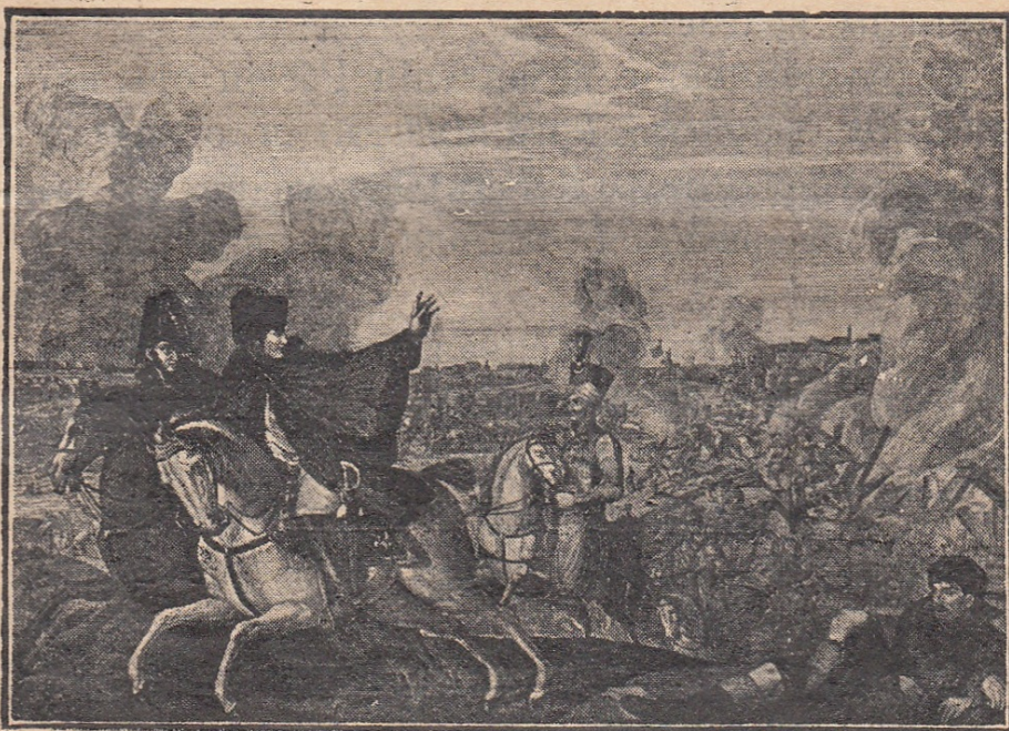
Бѣгство Наполеона изъ Россіи. (По современной народной гравюрѣ).

До Вильны дошло не болѣе четырехъ съ половиною тысячъ французовъ. Русскіе упорно преслѣдовали бѣглецовъ. Боковые непрі-