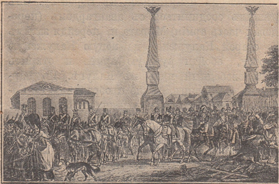
Выступленіе французовъ изъ Москвы.

Наполеонъ вышелъ изъ кремлевскаго дворца задумчивый и, молча, двинулся въ путь. Все еще большая армія его направилась на