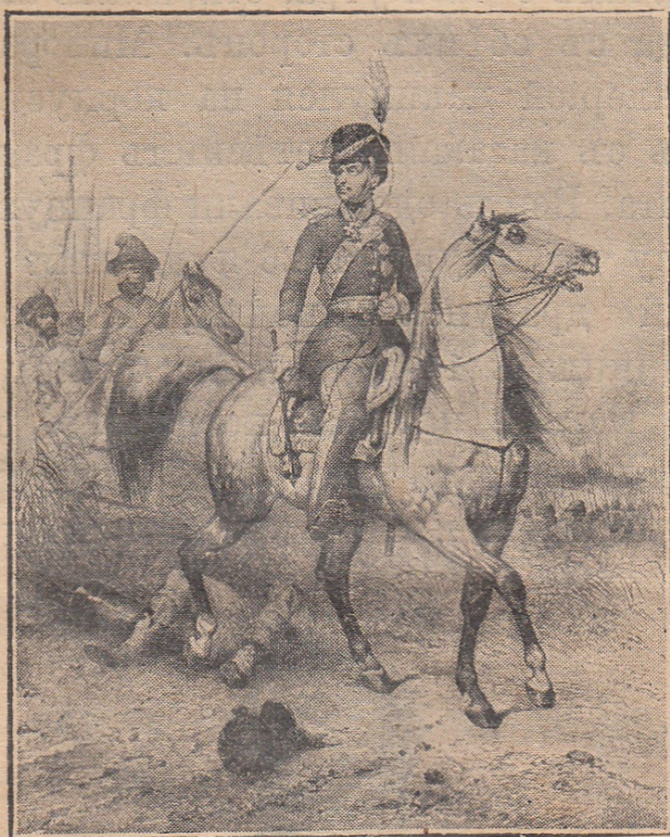
Гр. М. И. Платовъ.

Нашъ Фельдмаршалъ рѣшилъ неотступно преслѣдовать Наполеона, котораго въ тылу донимали донскіе казаки съ атаманомъ Платовымъ, а сбоку—корпусъ Милорадовича. Ата-