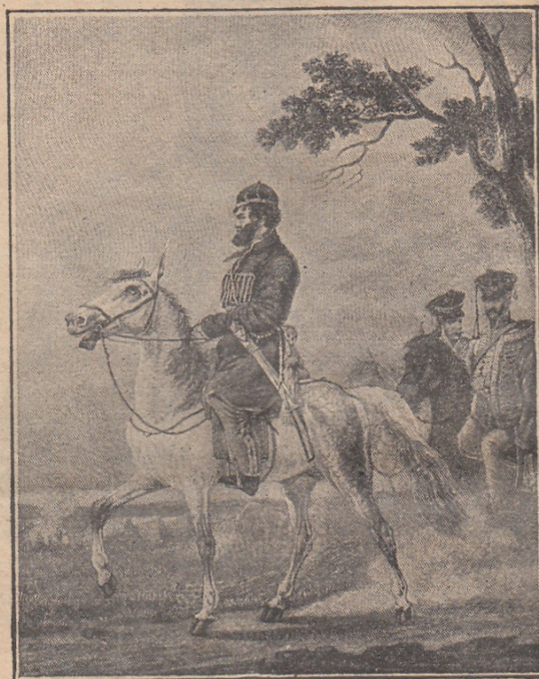
Д. В. Давыдовъ.

Слова Кутузова, что отступленія больше не будетъ, очень подняли духъ арміи. Солдаты готовы были ринуться на «француза» и раздавить его.