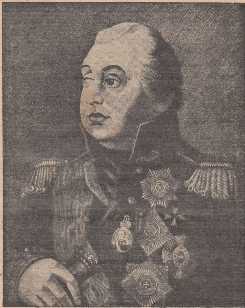
Генералъ-фельдмаршалъ князь М. И. Голенищевъ-Кутузовъ.