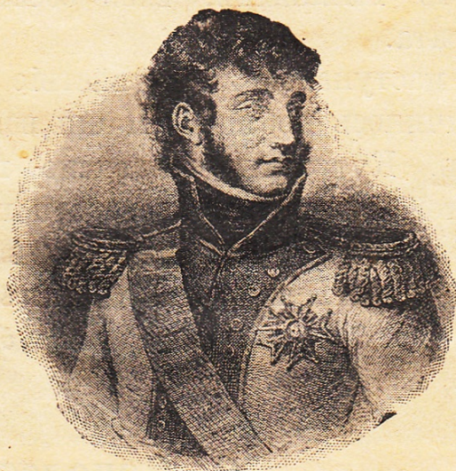
Французскій маршалъ Мюратъ.

Обманувшись въ своихъ надеждахъ на миръ, Наполеонъ, наконецъ, черезъ двѣ недѣли спохватился и послалъ своего зятя Мюрата съ пятьюдесятьютысячнымъ отрядомъ преслѣдовать Кутузова. За отрядомъ слѣдовалъ цѣлый обозъ награбленныхъ вещей: золотыя и серебряныя издѣлія, мѣха, сласти,