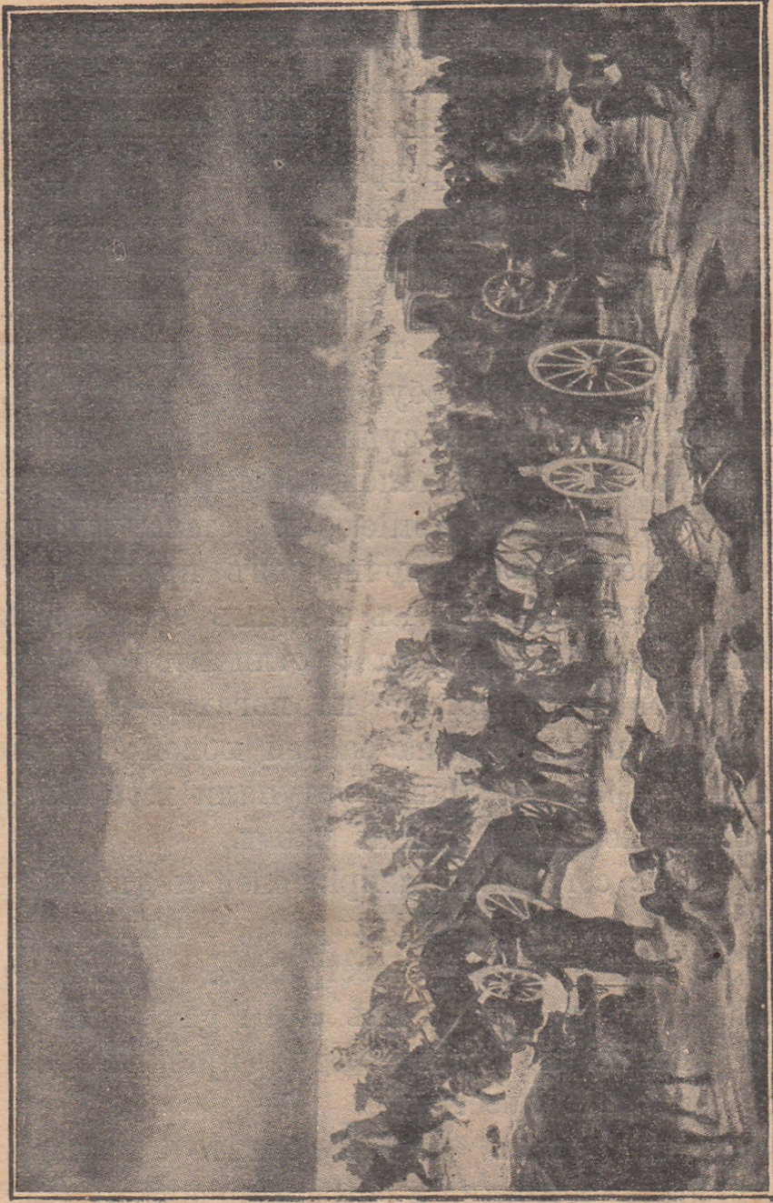
Отступление французской армии.