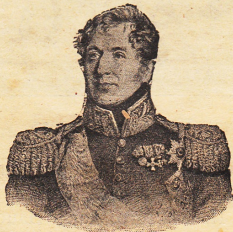
Гр. М. А. Милорадовичъ.

Въ началѣ 9 часа утра, открылась жестокая канонада съ обѣихъ сторонъ. Милорадовичъ съ кавалеріей накинулся на корпусъ Даву. Платовъ съ казаками потѣснилъ французовъ съ фронта. Верхъ одерживали французы, пока въ битву не вступили 26-я дивизія и Курляндскій драгунскій полкъ, къ которымъ присоединилась 11-я дивизія. Французы подались. Вскорѣ натискъ перновцевъ и кекегольмцевъ выбилъ ихъ изъ Вязьмы. Партизаны Фигнеръ и Сеславинъ влетѣли въ го-