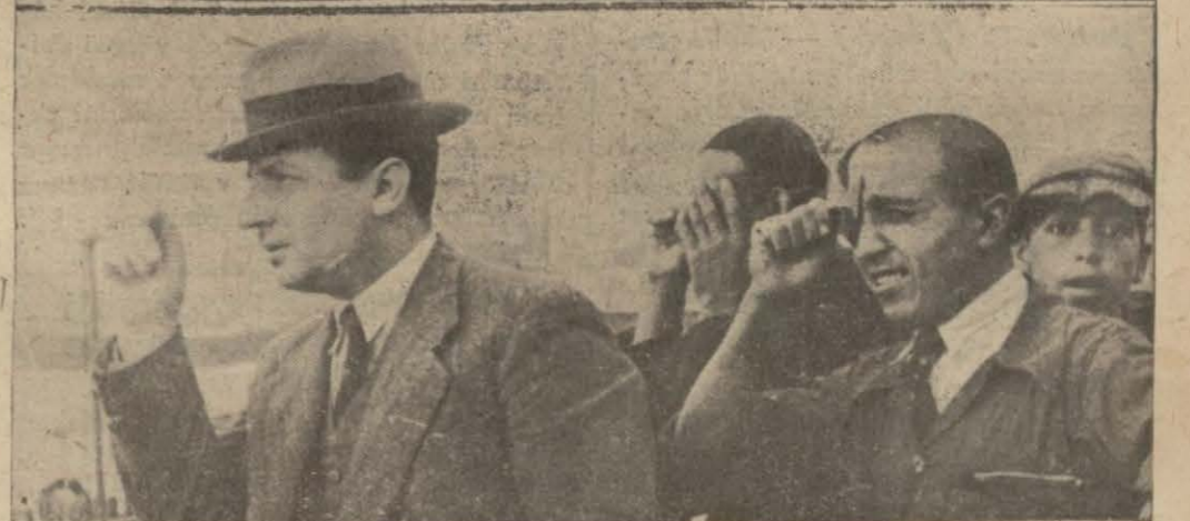
Yukarıda bu sabah güneşin küsufuna dair fotoğrafla tesbit ettiğimiz İki manzara, aşağıda Köprüden küsufu seyreden bir grup [Yazısı ikinci sahifemizde]