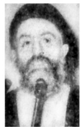
دکتر سیدمحمد بهشتی

آیت‌الله دکتر سید محمد بهشتی، در یک مصاحبه تلویزیونی، پیرامون بیانات اخیر امام خمینی سخن گفت و به تفسیر و تجزیه و تحلیل قسمت‌هایی از این بیانات پرداخت.