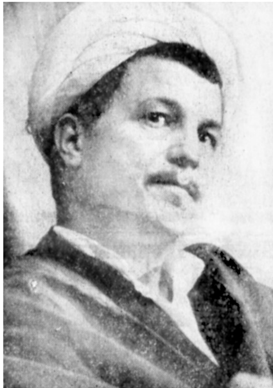
حجت‌الاسلام هاشمی رفسنجانی