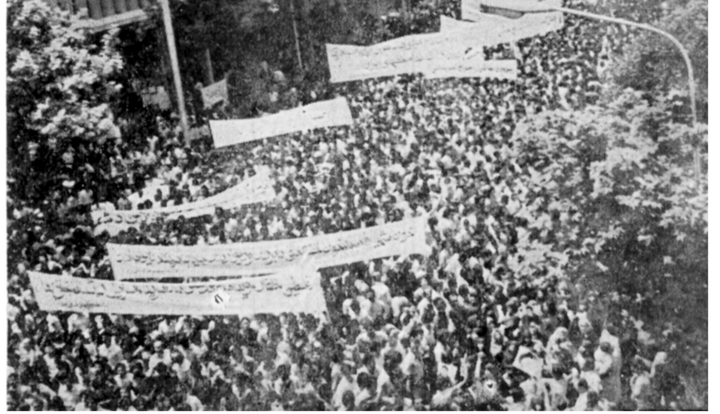
مظاهرات و ابراز خشم مردم دیروز جلوی سفارت آمریکا به اوج رسید. عکس چشم اندازی از سیل انسانی مبارزان ضد امپریالیسم رادر خیابان مبارزان (روزولت) جلوی سفارت آمریکا نشان میدهد.

پرچم‌های امریکادراتش این خروش سوزاننده شد و پیکره‌های کارترو بگین تیر باران گردید