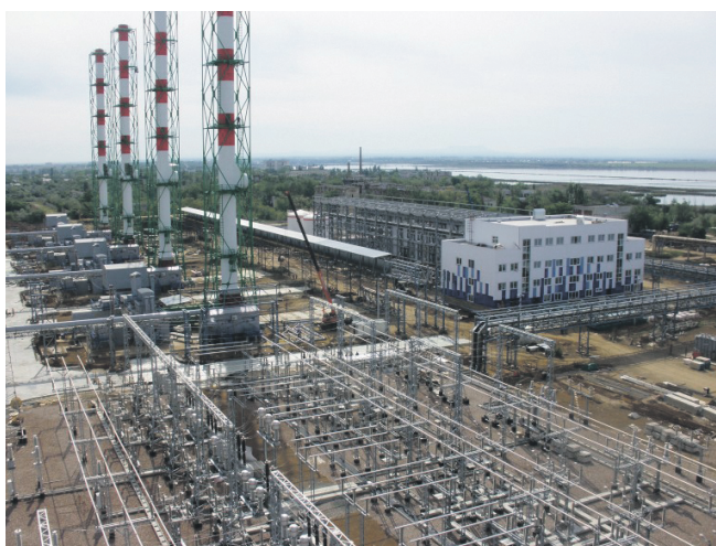
Перша черга Сакської ТЕЦ потужністю у 90 МВт (збудована до початку червня)