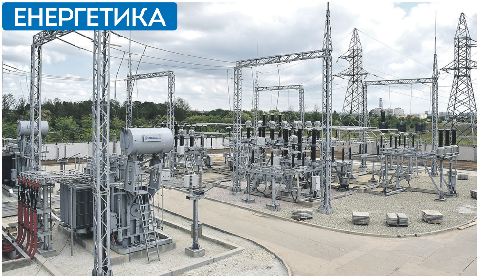
Підстанція 110 кВ «Аеропорт» у Сімферополі (початок травня)