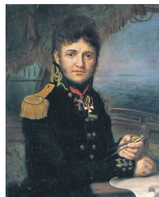
Юрій Лисянський. Портрет Володимира Боровиковського

алу створювати оповідання про морську стихію та трударів моря? Скільки таких авторів на всю велику Україну?