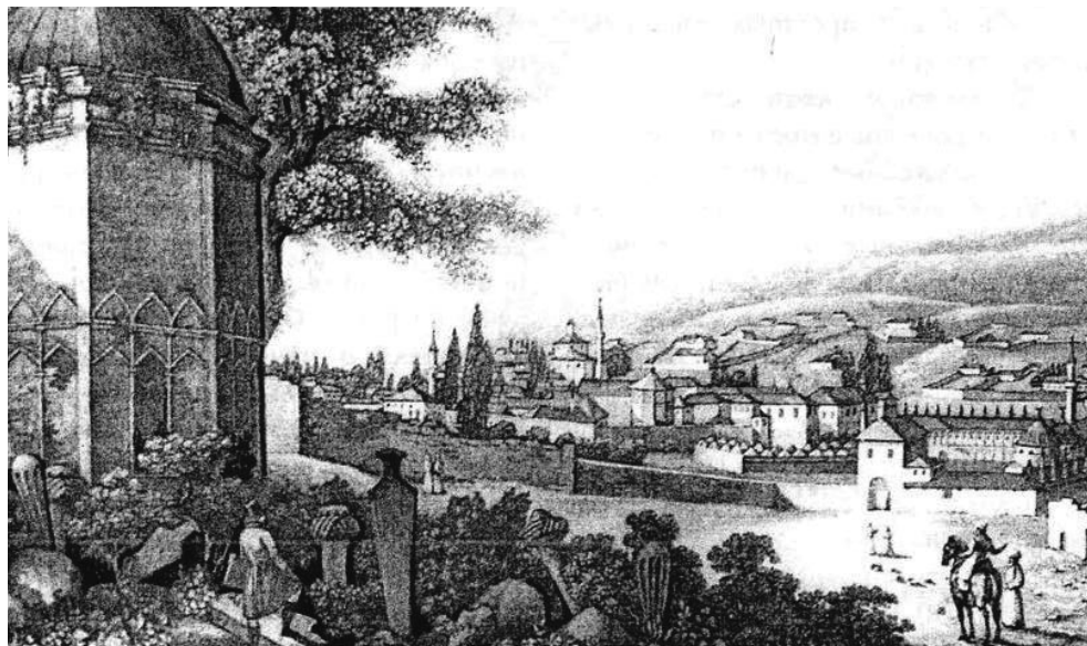
Бахчисарай – Вид Ханського палацу. Гравюра С. Хімлі

Наказ цей, звісно, не був виконаний, і до Буджаку був відправлений з військом калга Шагін-Гіреї, щоб примусити Кан-Теміра до покори; втім, той завчасно перевів свою орду на правий берег Дунаю, до володінь Оттоманської імперії поза територією, підвладною ханові. Шагін-Гіреї став до бою з Кан-Теміром, але був розбитий вщент і заледве врятувався відходом до Криму; туди ж,