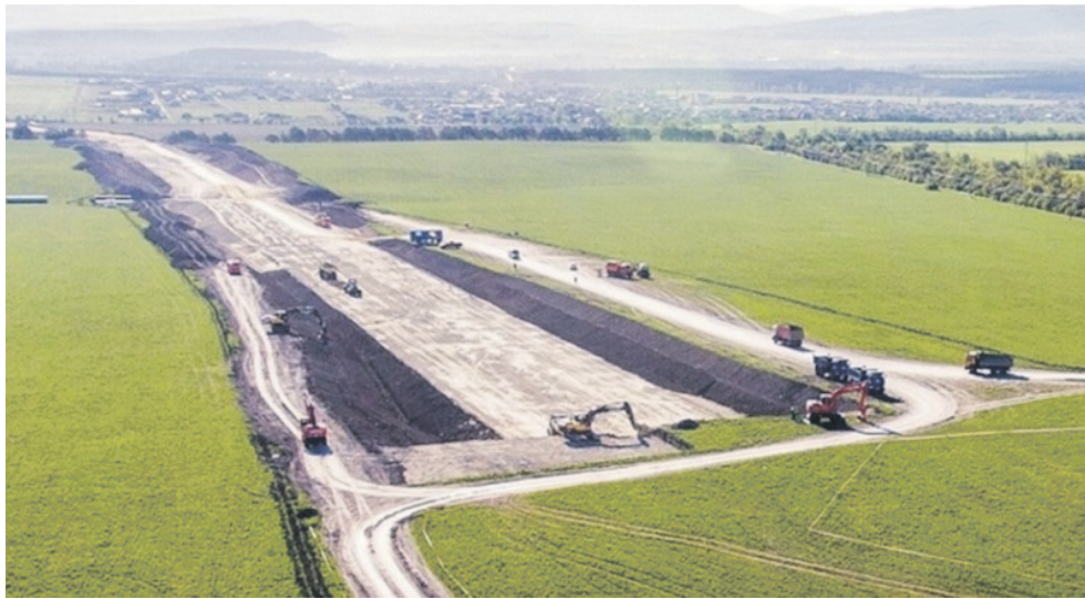
ФОТО З ВІДКРИТТЯ ДЖЕРЕЛ

кою, що територія РФ «прирошується ще на 27 000 км 2 ». Як було сказано кимсь у наговпі: «Крим знову перетворюється на півострів».