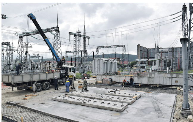
Реконструкція підстанції «Севастополь» (початок травня)

клад було названо «блекаут» восени 2015 р., який для окупаційних структур став «складним періодом у їхній новітній історії». У «відомстві» запевнили, що 4-та нитка «енергомосту» до Криму з Кубані, запущена у травні 2016 р., нібито забезпечила можливість перетоків сумарно до 800 МВт у максимумі з російської